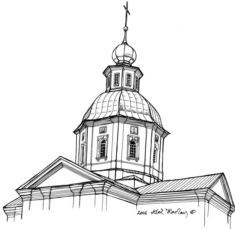
Зовнішній вигляд верху Миколаївської соборної церкви Самарського Пустельно-Миколаївського монастиря у кінці XIX ст. (втрачений). Малюнок автора за архівними матеріалами. Друкується вперше.

При будівництві будинку престарілих металургів церкву перетворено на клубний корпус. Залишки мурованої хрещатої однобанної церкви стоять у центрі Самарського монастиря (статус монастирю повернуто у 1996 р.), що розташований на березі річки Самарчик. Навіть без втраченого верху будівля домінує серед прилеглої забудови монастирського комплексу. Її хоча і взято під охорону (охор. № 1081) [27; 132], вона все одно потребує капітального ремонту, відновлення втраченого верху, демонтажу перекриття, що спотворює внутрішній простір храму. Необхідно, щоб дослідження, проекти реставрації, проекти розписів та іконостасів у таких храмах (пам'ятниках архітектури) розглядалися радами фахівців, і це є нагальною потребою.