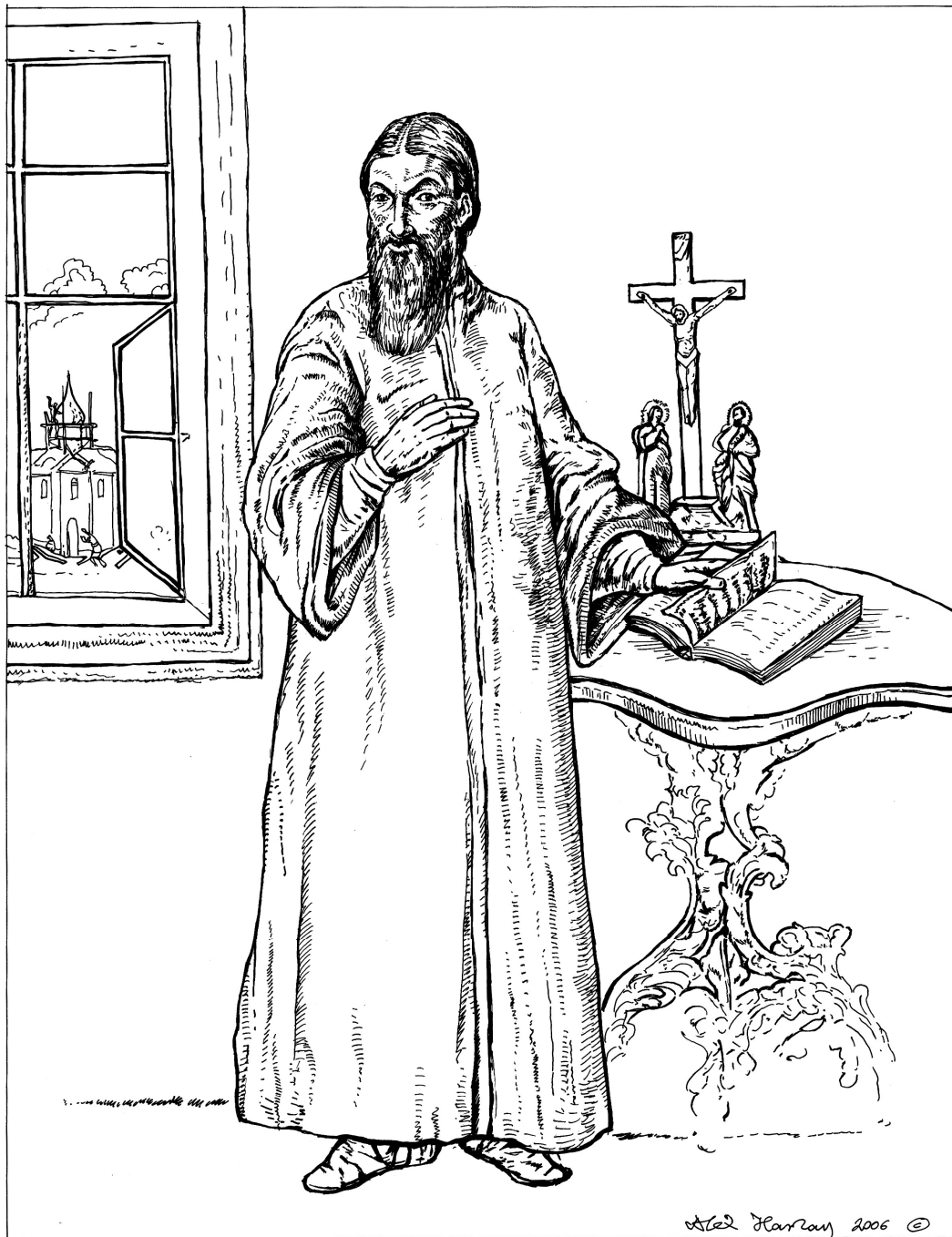
Портрет Кирила Тарах-Тарловського. Прорис автора з копії кінця XIX ст. зробленої з оригіналу 1784 року. ДІМ

На традиційному за схемою композиції портреті зображено священика у бархатній рясі, що стоїть коло стола і лівою рукою перегортає книгу, праву руку прикладаючи до грудей. У лівому верхньому кутку картини зображено вікно, через відкриту кватирку якого видно церкву в лісах, біля якої працюють робітники. Здавалося б, нічого неприродного, окрім того, що Тарловський перегортає книгу лівою рукою, відвернувши голову в протилежній бік [15; 124]. Писане у 80-х роках XVIII ст., це зображення відображає нове розуміння функцій портрета, який незважаючи на свою традиційну схему, на чільне місце ставить не репрезентативні завдання, а розкриття внутрішнього світу людини [16; 203].