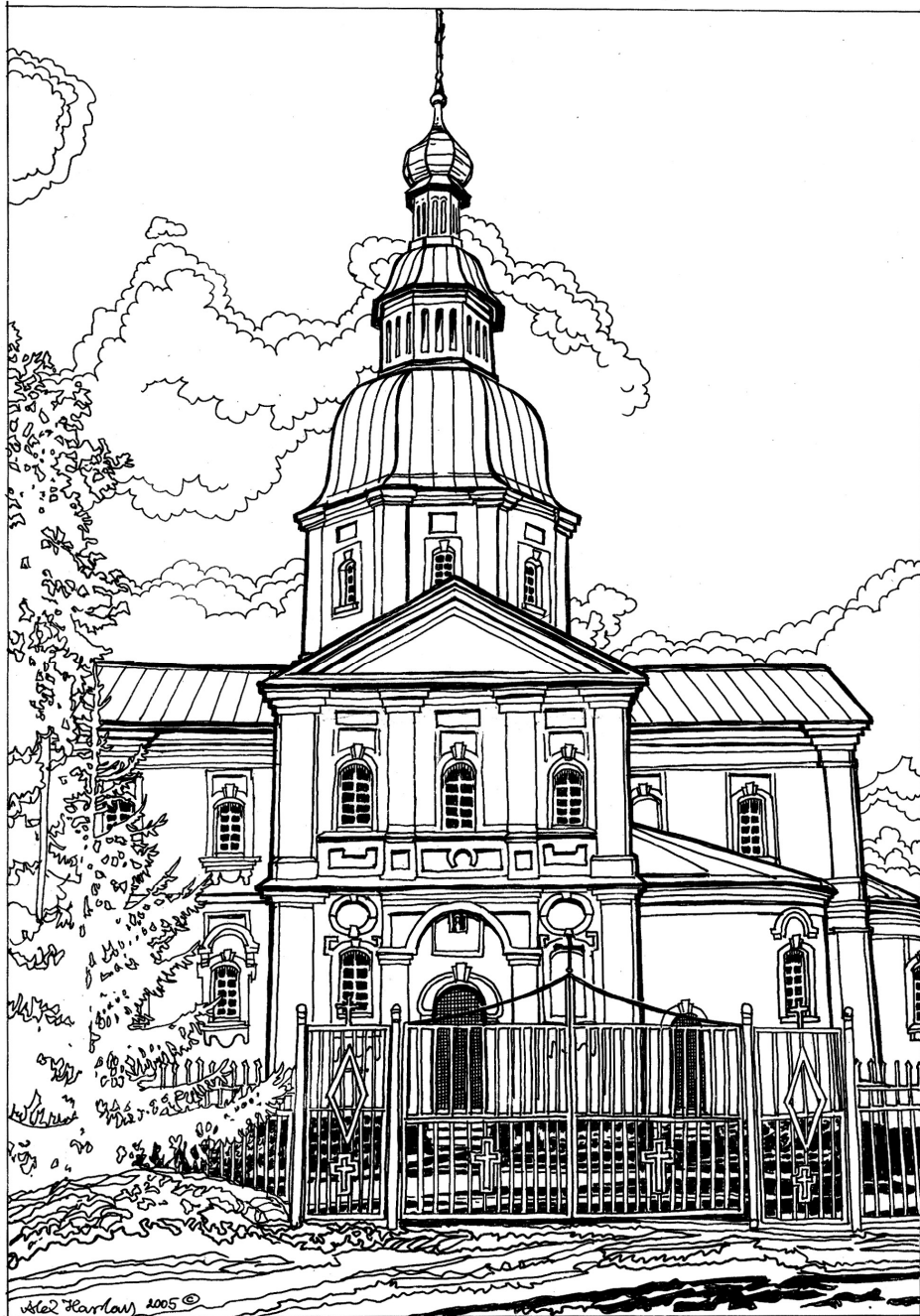
Церква святого Миколи у містечку Козельці Чернігівської області. Південний фасад. Споруджена у 1781-1784 рр. Вигляд після реставрації 1981-1989 рр. Малюнок автора.