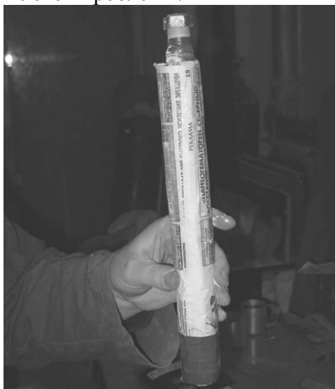
Рис. 2. Патрон НРС первой серии опытов

Но снижение интенсивности перемешивания является недостатком данного способа, поэтому работа над разработкой патрона продолжается и в скором будет предложено новое решение этой проблемы.