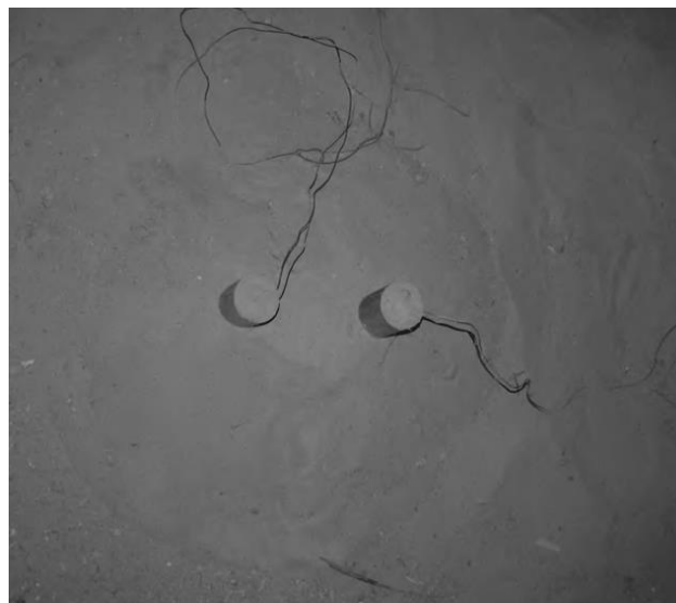
Рис. 3. Общій вид експеримента