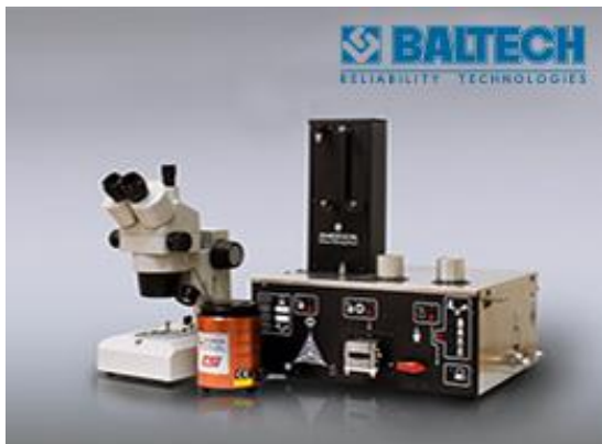
Рис. 3. Портативна міні лабораторія для аналізу трансформаторного масла

Особливо привабливо цей метод виглядає при виконанні переносного ІЧ – аналізатора 1100, пропонованого даною компанією. Зовнішній вигляд ІЧ – аналізатора 1100 наведено на рис. 4.