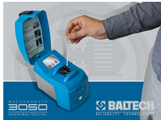
Рис. 4. ІЧ- аналізатор 1100

Даний прилад дозволяє визначати такі важливі характеристики масла, як обсяг води, загальне лужне число, загальне кислотне число, вміст сажі, гліколя, присадок і окислення масла. Крім того, він не вимагає застосування розчинників і пробопідготовки, характерних для класичного лабораторного ІЧ - аналізу. За допомогою ІЧ – аналізатора 1100 можливо отримати інформацію про критичний стан масла за 2 хвилини. Як правило, в комплекті з переносним ІЧ - аналізатором 1100 слід застосовувати портативний віскозиметр 3050, який дозволяє визначати кінематичну в'язкість масла (одного з основних показників масла) також на робочому місці і мати, таким чином, повне уявлення про стан масла. Результати порівняння традиційної системи аналізу масла та сучасних методів наведені в табл. 2.