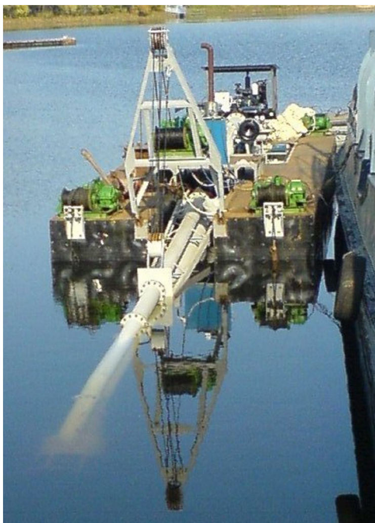
Рис. 2. Эжекторный земснаряд ЗНС 630-90

СГЗ 630-90 работает следующим образом: вода по напорному трубопроводу 1 подается под давлением в напорную камеру 2. Из напорной камеры вода истекает через эжекционные форсунки 4 в смесительную камеру 6 и через размывающие форсунки 5 истекает в массив грунта, размывая и насыщая его. Под воздействием высоконапорных водяных струй, истекающих через эжекционные форсунки 4 в смесительную камеру 6, во всасывающей патрубке 3 образуется область разрежения, под воздействием которой подготовленный в забое грунт движется в смесительную камеру 6, где потоки перемешиваются. Через горловину 7 пульпа транспортируется в напорный пульпопровод 8, после чего – к месту складирования или переработки. Рекомендованная технология применения разработанного грунтозаборного устройства, при которой можно достичь его максимальной эффективности –ямочная технология добычи.