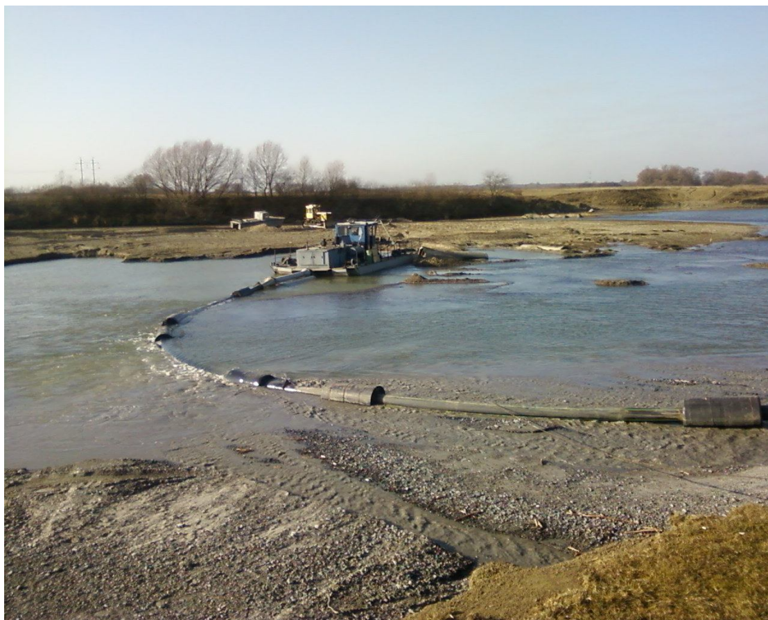
Рис. 3. Эжекторный земснаряд ЗНС 630-90 для климатических условий Европы

В целом эжекторный земснаряд ЗНС 630-90 успешно прошел опытно-промышленные испытания, в результате которых определены его эксплуатационные характеристики: