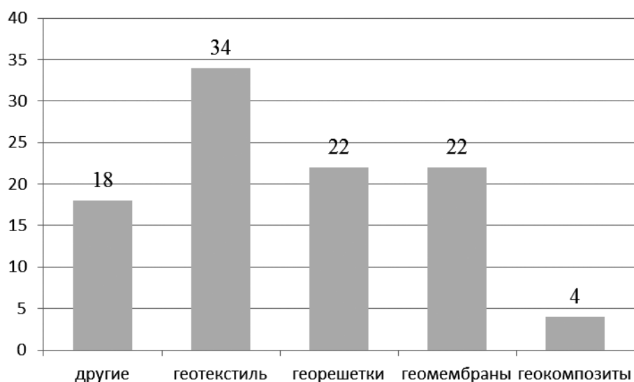
Рис. 3. Использование геосинтетических материалов в мире

Также перспективными и интересными геосинтетическими материалами, применяемыми для укрепления откосов и склонов, являются геоматы и геокомпозиаты.