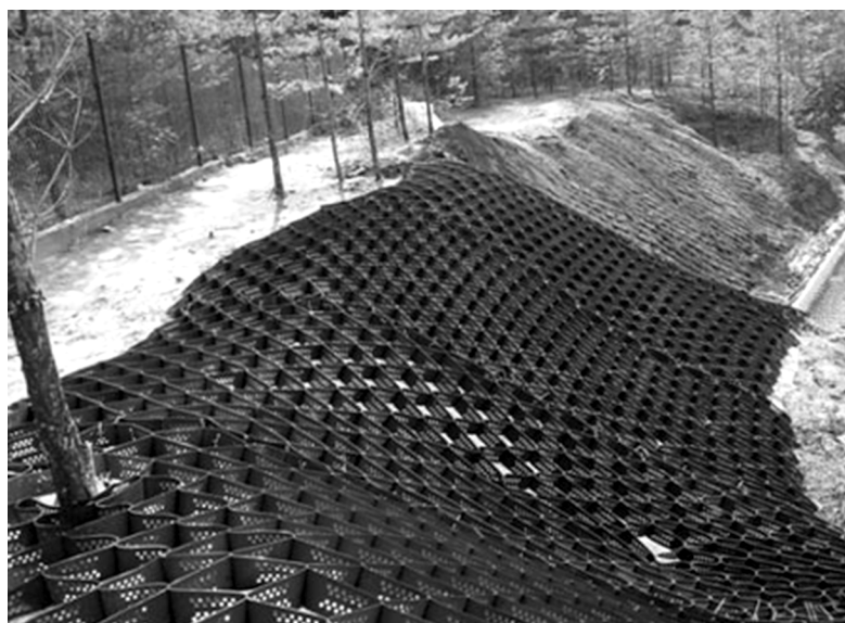
Рис. 4. Схема армирования откоса объемными георешетками

Укрепление склонов объемной георешеткой – один из наиболее эффективных методов в тех случаях, когда применение других укрепляющих конструкций, например габионных, невозможно из-за неровного рельефа склона, особенностей грунта и ряда других причин. Пример армирования откоса объемными георешетками представлен на рисунке 4. Перфорированные стенки ячеек георешетки улучшают дренажные характеристики конструкции, что обеспечивает рост разного рода растительности. Вместе с тем следует подчеркнуть, что выбор конкретного геосинтетического материала с определенным размером ячеек решетки необходимо проводить в зависимости от цели применения материала. Так, георешетка с крупными ячейками будет наиболее целесообразна в использовании на достаточно пологих склонах с умеренно прочным основанием грунтовой поверхности, а крутые откосы следует укреплять с применением георешетки с меньшим размером ячеек. Также от крутизны армируемого склона зависит выбор засыпного материала [2, 4].