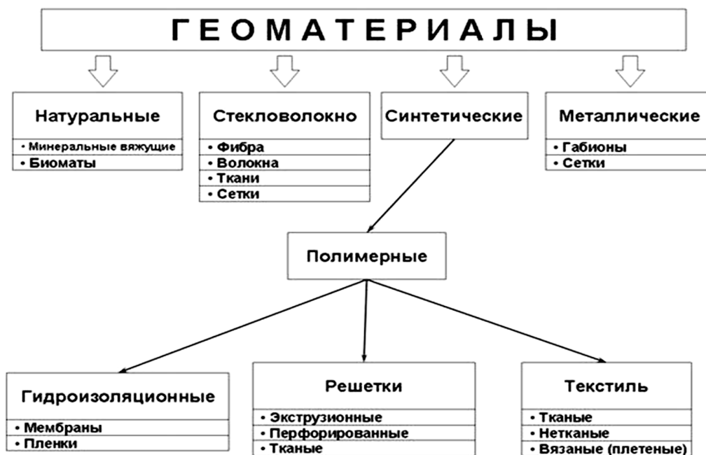
Рис. 1. Классификация геоматериалов

Под геоматериалами понимают строительные материалы, которые, выполняя свои функции в контакте с грунтом или другими строительными материалами в геотехнике или других сферах строительства. Несмотря на большую необходимость в нормативных документах, регламентирующих применение геосинтетических материалов в строительстве, нормативная база этой отрасли еще только формируется [1,3]. Также в настоящее время не разработана общепринятая классификация геоматериалов. Существующая классификация имеет вид (рис. 1):