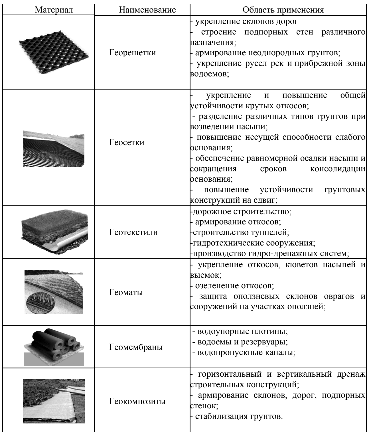
Основные виды геосинтетических материалов

Георешетка – это сотовая конструкция из полиэтиленовых лент, соединенных между собой сварными швами с высокой прочностью, которая в рабочем положении представляет собой устойчивый каркас в горизонтальном и в вертикальном направлении. При помощи этого каркаса фиксируются различные наполнители – щебень, грунт, бетон, кварцевый песок и другие. Высокие стенки позволяют заключать в себе также и крупнозернистый материал.