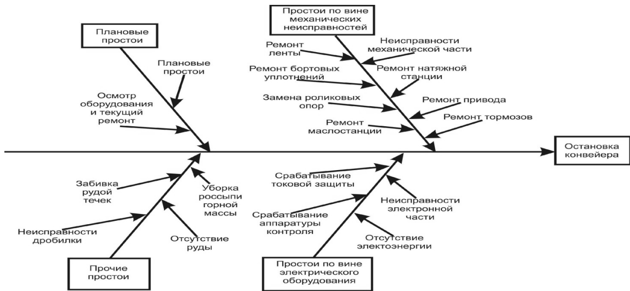
Рис 1. Диаграмма «причин и результатов» для анализа и оценки рисков простоев конвейерной системы карьера.

где A_i p^i - есть тензорная свертка [2,3].