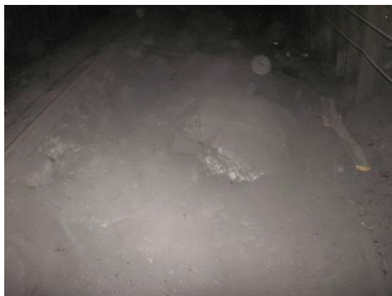
Рис. 2. Южный ходок уклона №1 пласта l_8 горизонта 550 м ПК 52-8 рам

На шахте «Новодонецкая» обследованы четыре выработки: северный ходок центрального бремсберга пласта k7, 2 южный вентиляционный штрек пласта k7, центральный бремсберг пласта k7, 1 северный вентиляционный штрек центрального уклона пласта k7. Способ проведения штреков – комбайновый (КСП-32). Применяемая крепь АП-13,8. Шаг установки рам крепи – 0,8 м. Тип применяемой затяжки – деревянная.