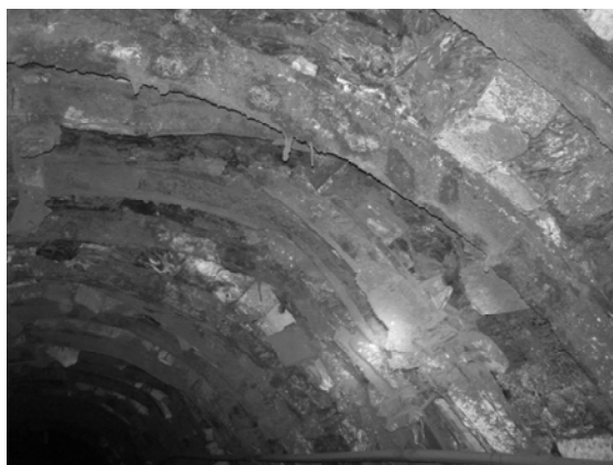
Рис. 1. Северный ходок уклона №1 пласта l_8 горизонта 550 м ПК 9...10

Основные виды деформаций пород и крепи в обследуемых выработках: коррозия верхняков (рис. 1), искажение геометрической конфигурации выработки, прогиб верхняков, разрывы стоек на уровне замков, разрывы хомутов в замках, смещение хомутов, пучение пород почвы (рис. 2). Во всех выработках имеет место либо отсутствие забутовки закрепного пространства, либо некачественное ее выполнение.