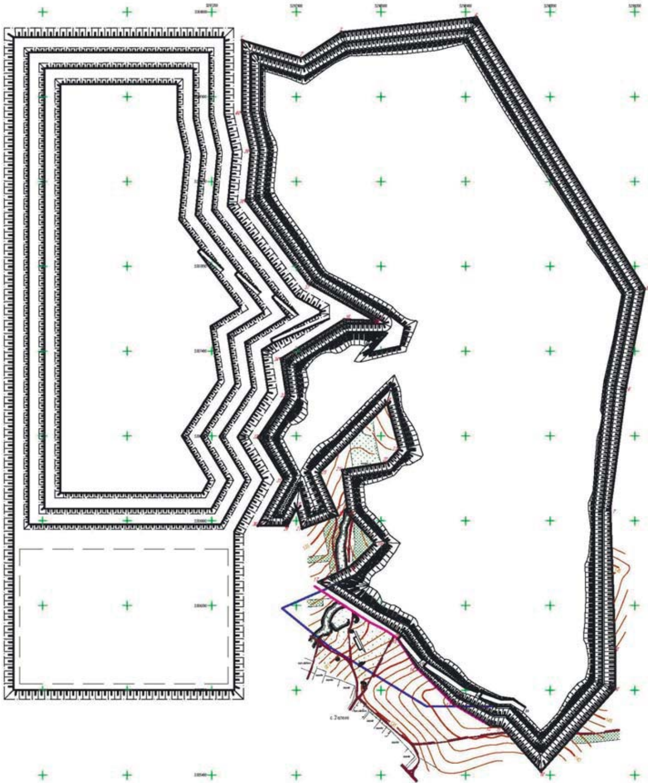
Рис. 1. Відпрацювання Східної ділянки Біляївського родовища за варіантом I