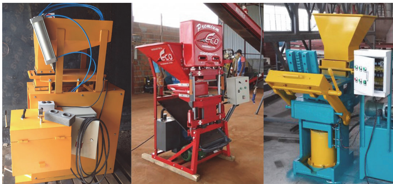
Рис. 2. Зображення станків-пресів для виготовлення цегли

У зв'язку з розвитком промисловості нерудних будівельних матеріалів гірничо-видобувні підприємства оснащуються новітнім обладнанням. Наприклад, для виготовлення цегли вже не потрібні величезні заводи, а існують багатофункціональні мобільні установки, які можуть виготовляти цеглу з температурним режимом – запікання, так і під дією тиску – пресування. Таке устаткування вже успішно використовується в Україні, прикладом служить обладнання Джуринського кар'єру (рис. 2).