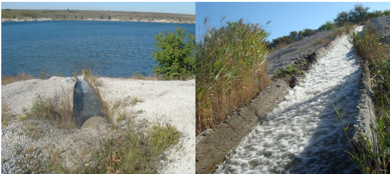
Рис.1. Сброс шахтных вод в пруд-накопитель б. Свидовок

Пробы почв отбирали на расстояниях 100, 500, 1000, 1500 и 2000 м от пруда-накопителя в четырех направлениях света. В отобранных пробах было определено содержание водорастворимых солей, тяжелых металлов и гумуса.