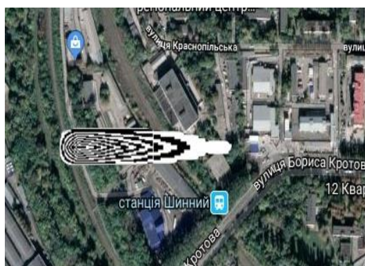
Рис. 2. Зона загрознєння атмосфєри для моменту часу t=8 мин