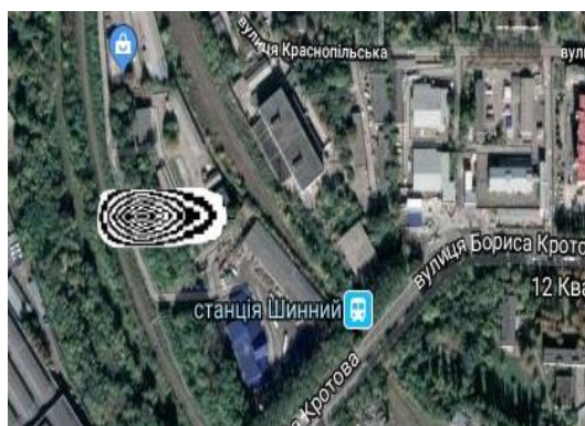
Рис. 1. Зона загрознєння атмосфєри для моменту часу t=3 мин

Как видно из рис.1-3 при эмиссии хлора из цистерны формируется зона загрязнения в виде «языка». Эта зона загрязнения вытягивается в направлении движения воздушных масс и захватывает селитебную территорию (рис. 3). Это создает угрозу токсичного поражения людей.