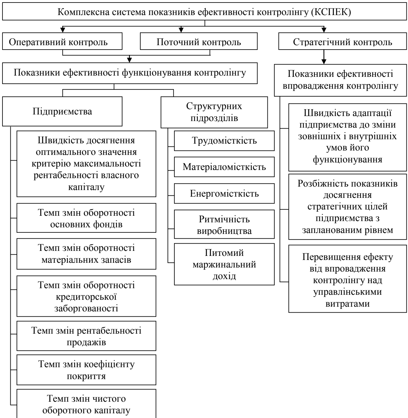
Рис. 1. Показники ефективності впровадження та функціонування контролінгу (КСПЕК)

При цьому, показники ефективності функціонування контролінгу на рівні підприємства відібрано на основі реалізації таких етапів: з метою забезпечення цільової спрямованості планування, аналізу та контролю визначено тісноту зв'язків між показниками фінансового стану підприємства; відібрано ті з них, які мають значний вплив на рентабельність власного капіталу, та визначено темпи зміни цих показників.