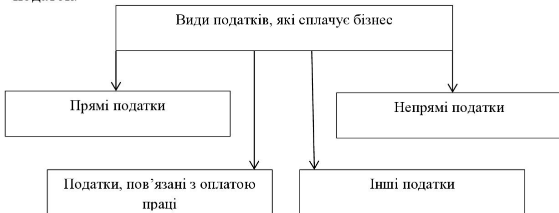
Рис. 1.3 Види податків бізнесу

Розмір прямих податків залежить від фінансових результатів діяльності (прибутку або доходу). До них належать податок на прибуток підприємств, податок на доходи фізичних осіб - підприємців та єдиний податок.