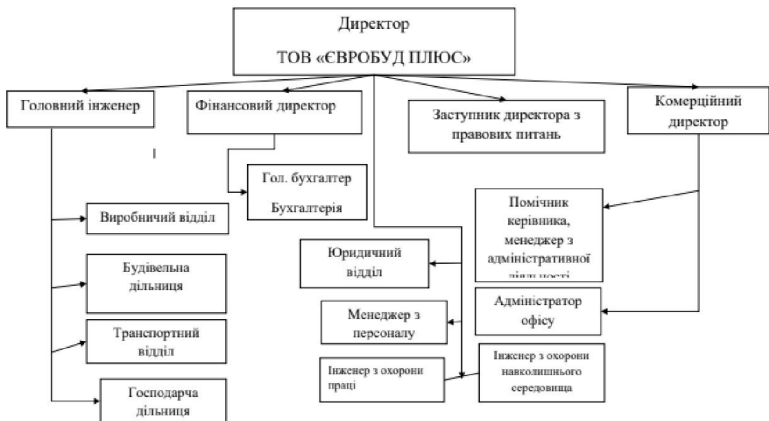
Рис.1.2. Організаційна структура ТОВ «Євробуд Плюс»

У 2021 році організаційна структура Товариства мала наступний вигляд (Рис.1.2):