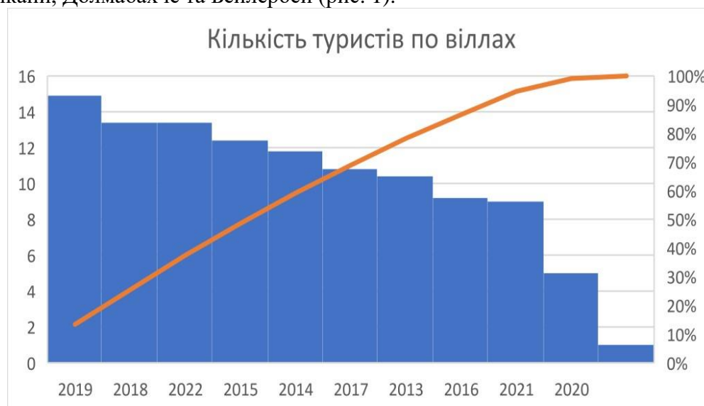
Рисунок 1 – Оцінка туристських потоків Стамбулу за 2022р.

Туреччина вважається однією з найкращих туристичних країн. Західноазійська країна знаходиться на території Західної Азії та є частиною Балканського півострова Європи. Країна славиться великою кількістю історичних пам'яток, неймовірними пейзажами, горами, традиціями, а також омивається чотирма морями: Середземним, Егейським, Мармуровим та Чорним. Туреччина з кожним роком розвивається у сфері туристичного бізнесу та має багато попиту завдяки сучасній інфраструктурі, різноманітності екскурсій. Але перше місце посідає морський туризм, оскільки Туреччина славиться пляжними курортами та морями. Також важливу роль на потоки туристів відіграє сезонність. Вона починає наростати з травня та досягає піку в серпні, оскільки саме в цей період найсприятливіший м'який клімат для відпочинку [1,2]. Найпопулярніше місто в якому розвивається туризм – це Стамбул. Визначними місцями там вважаються мечеті Айя-Софія та Султанахмет, протока Босфор, палаці Топкапи, Долмабахче та Бейлербей (рис. 1).