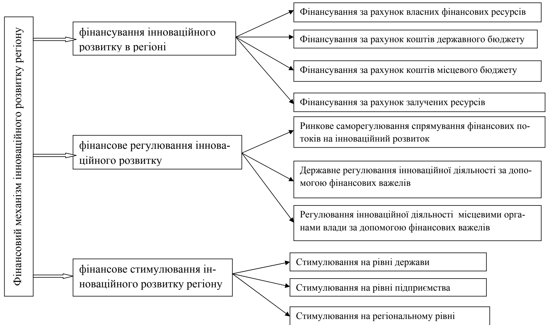
Рис.2 - Структура фінансового механізму інноваційного розвитку регіону