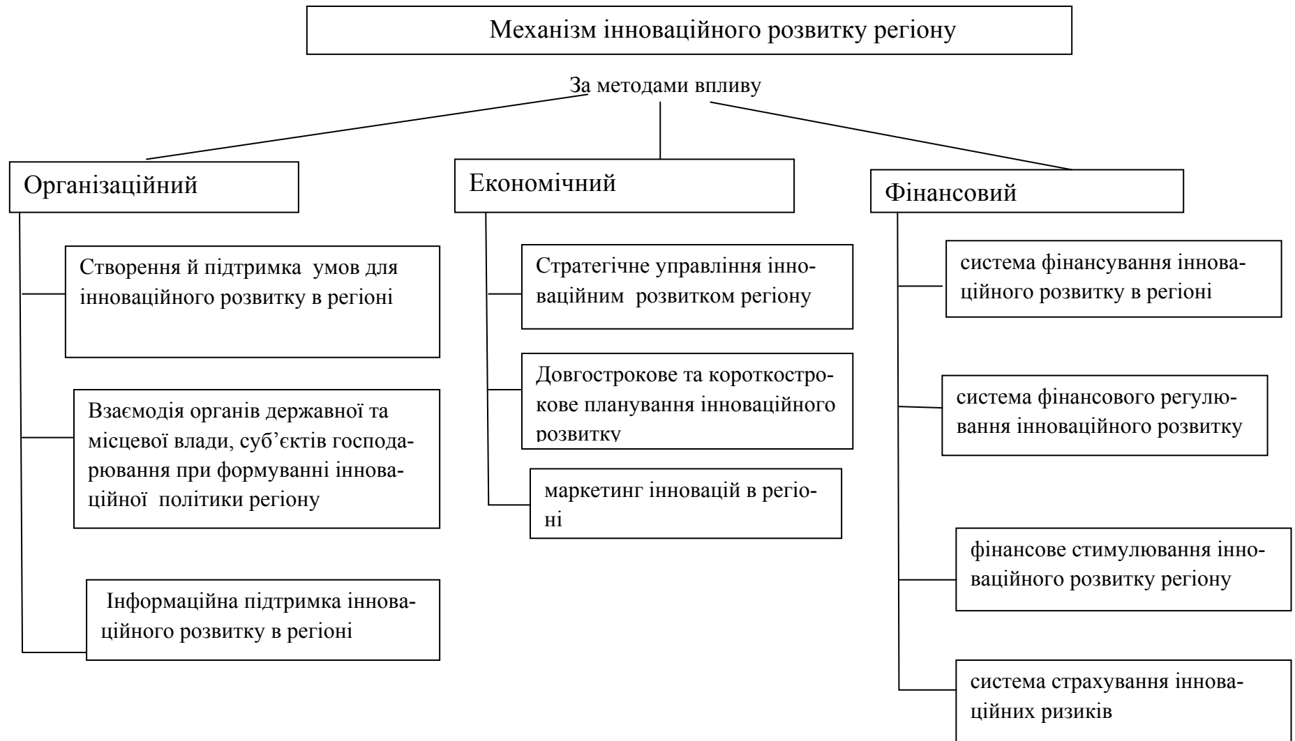
Рис. 1 – Складові механізму інноваційного розвитку регіону за методами впливу