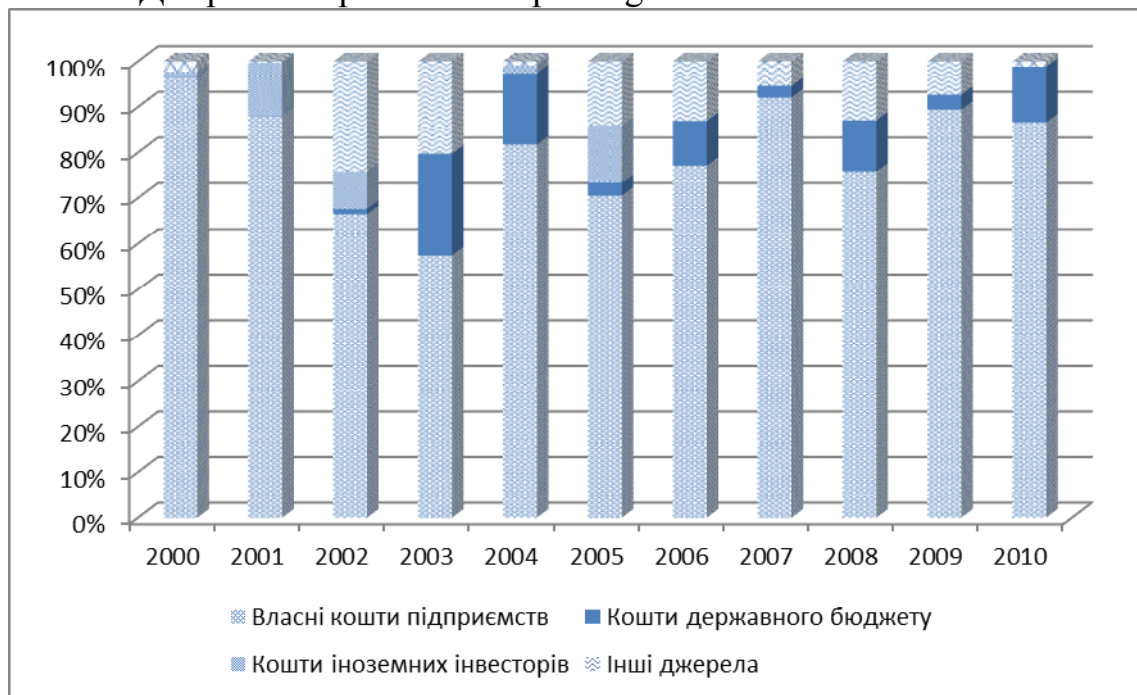
Рис. 4 - Розподіл джерел фінансування інноваційної діяльності в Дніпропетровській області з 2000 по 2010 роки