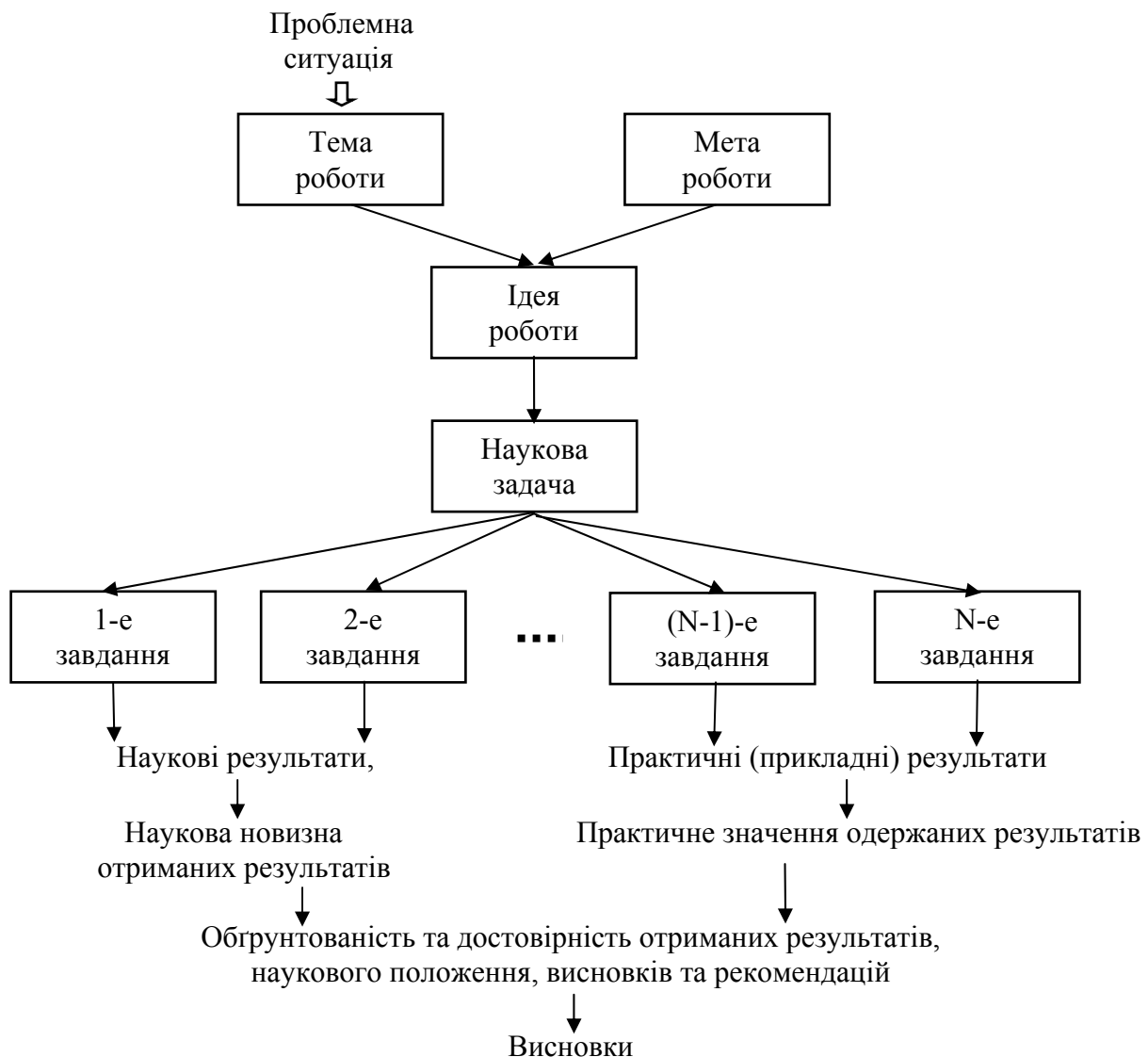
Рис. 1.1. Структура основних логічних складових дипломної роботи.

Характерний зв'язок теми роботи з основними логічними складовими дипломної роботи показаний на рис. 1.1.