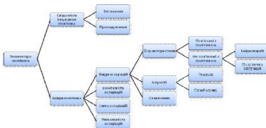
Рисунок 2. Структура знання про політика.

Вище описана модель не була перевірена дослідженнями, але може бути використана як стратегічний інструмент для політехнологів.