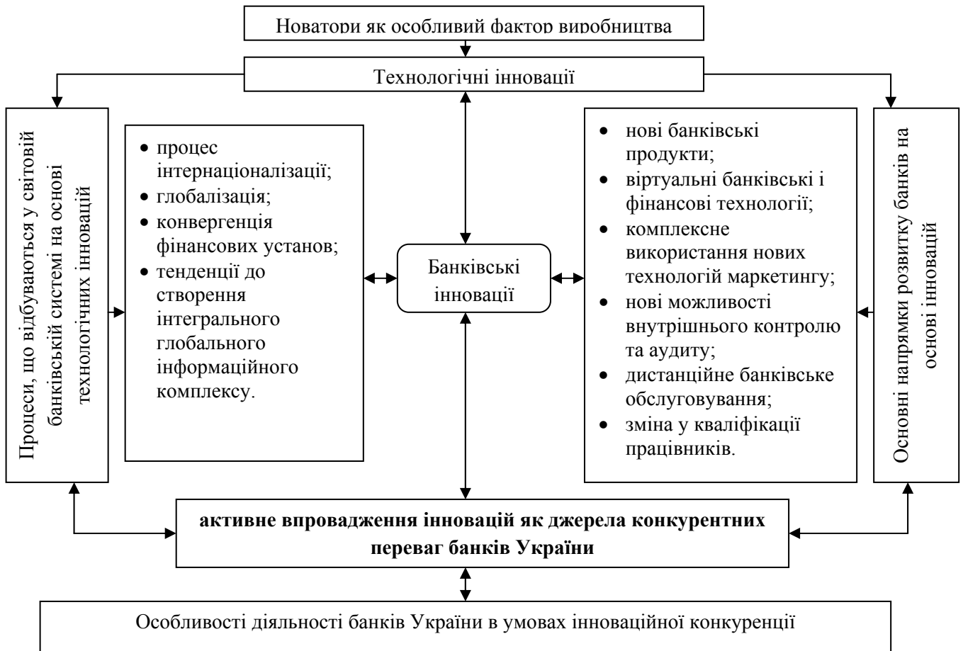
Рис. 1. Функціональна модель розвитку інноваційної конкуренції в банках України