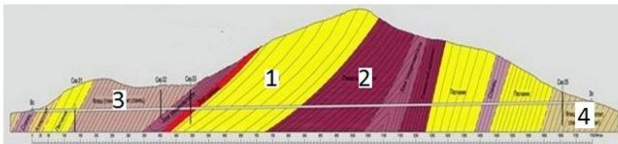
Рис. 1. Геологічний розріз: 1 – піщаники; 2 – глинисті сланці із зоною тріщинуватості; 3 – сланці; 4 – аргіліти.

Викладення основного матеріалу. Будівництво нового тунелю буде здійснювалась в породах з f = 1.5-4.0 , що представлені в основному піщаниками, глинистими сланцями та аргілітами, за допомогою буровибухової технології (рис. 1).