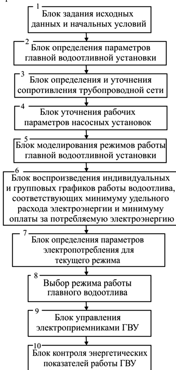
Рис. 1. Схема алгоритма моделирования энергоэффективных режимов работы ГВУ

В блоке 6 воспроизведения индивидуальных и групповых графиков работы водоотлива перебираются смоделированные варианты и выбираются из них циклические режимы для заданного периода времени (обычно суточного интервала). Среди полученного множества графиков выбираем режим работы водоотливной установки, который соответствует критерию минимального удельного расхода электроэнергии на откачку воды при минимальной величине оплаты за ее потребление.