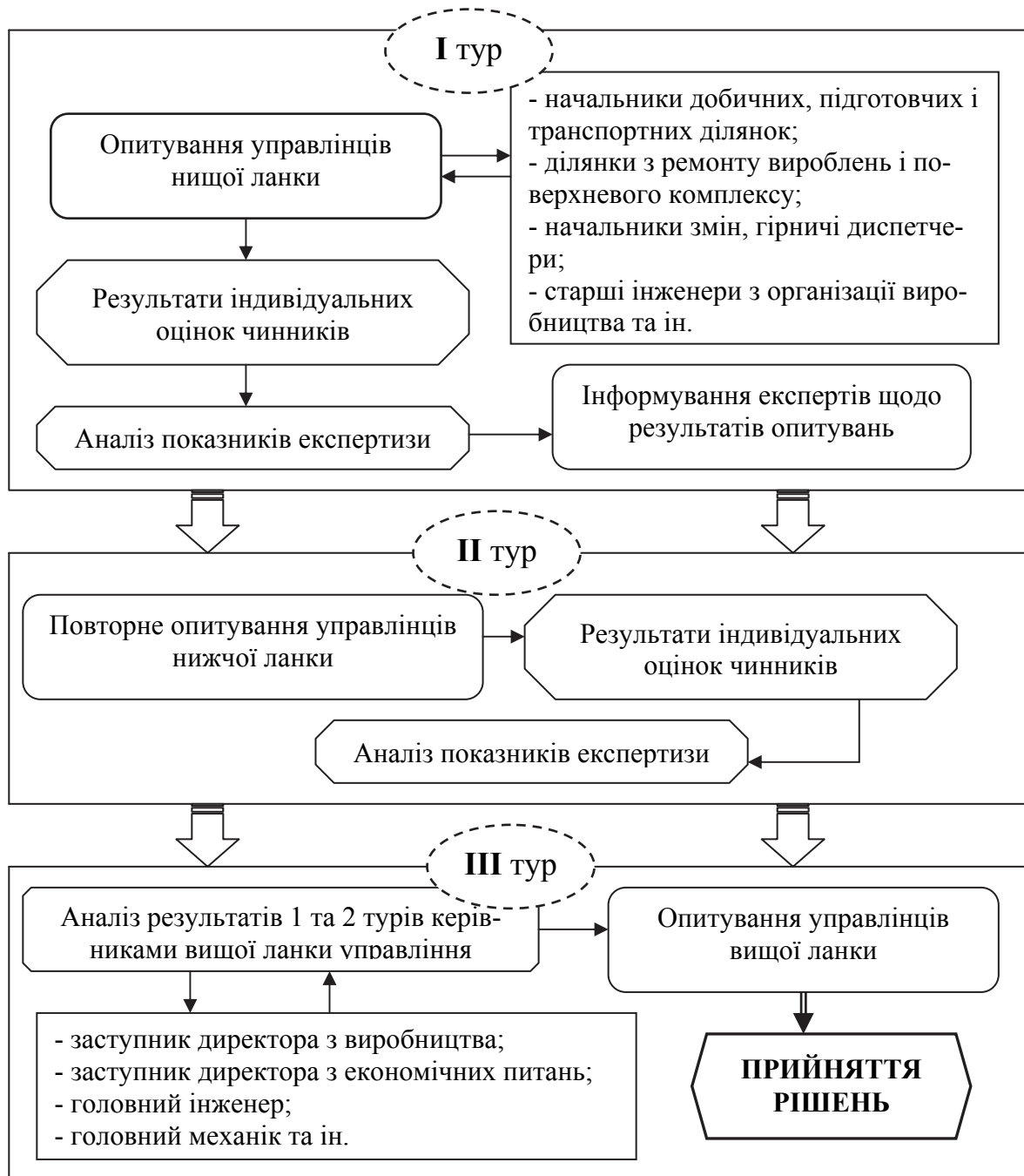
Рис. 1. Алгоритм проведення експертизи