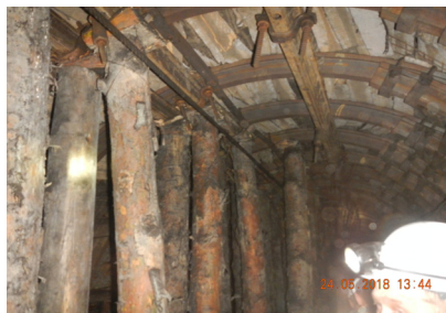
Состояние выработки на расстоянии 100 м ниже окна лавы