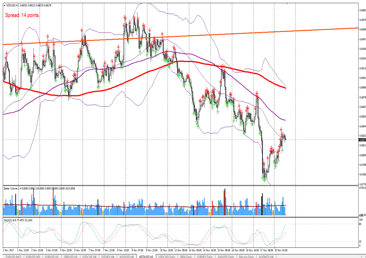
Рис. 2. Результат пошуку патернів Price Action і точки входу, які вони генерують, на графіку валютної пари NZD/USD H1

Пошук патернів Price Action здійснюється від попередньої свічки в заданому в налаштуваннях діапазоні. Для визначення кожного простого патерну, що складається з однієї свічки, розроблена функція, яка порівнює параметри свічки відповідно до параметрів патерну. Кожна функція має тип bool і повертає true у випадку, якщо патерн був знайдений (рис. 2).