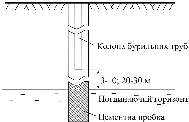
Рис. 1 Схема тампонування поглинаючого горизонту

залишків тампонажного розчину. Розчин, що вимивається, щоб уникнути забруднення бурового розчину, відводять в окрему ємність. Операція завершується очікуванням твердіння тампонажного розчину (ОЗЦ), яке зазвичай досягає 16-24 години.