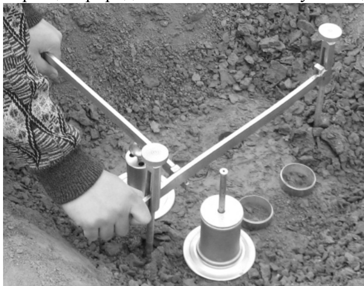
Рис. 1. Отбор образцов грунта

Отбор образцов грунта для экспериментов, на глубинах от 0,7 до 6 метров, проводился с помощью полевой лаборатории Литвинова (ПЛЛ-9) предназначенной для ускоренных исследований строительных свойств структурно устойчивых и макроскопических грунтов в полевых условиях. Образцы природного сложения на глубинах до 1 м отбирались непосредственно