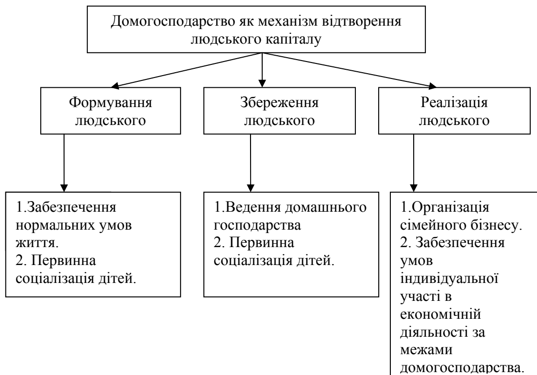
Рис. 1. Домогосподарство як механізм відтворення людського капіталу

Наприклад, розглянемо домогосподарство, визначальною функцією якого є відтворення людського капіталу (Рис.1)