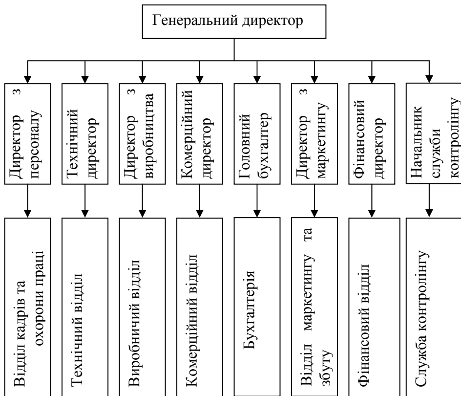
Рис. 2. Схема підпорядкування служби контролінгу безпосередньо директору підприємства