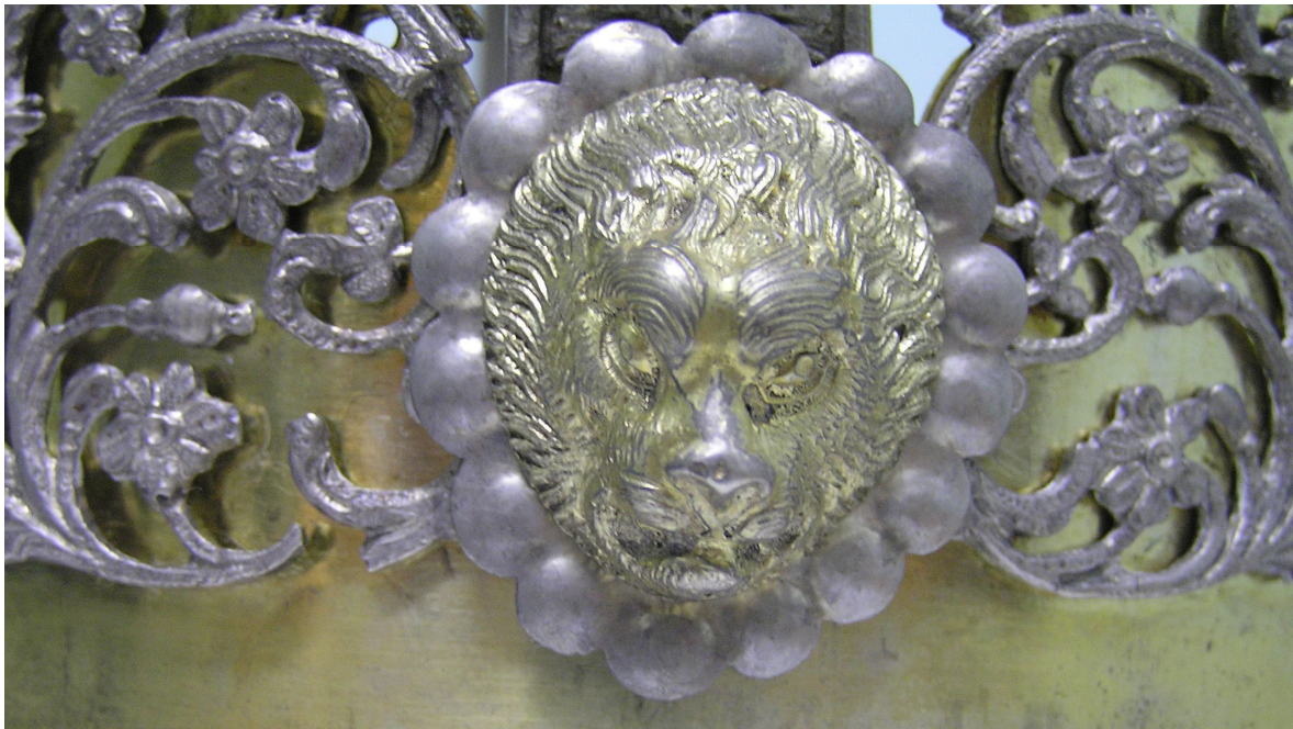
Фото 6. Зображення на уманській короні

свій досвід та майстерність у постійних професійних контактах.