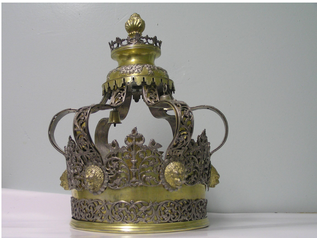
Фото 1. Корона з Умані

Саме в етнографічному, найменш документованому розділі каталогу і записана корона Тори, яка нині зберігається в Дніпропетровському історичному музеї. Але, на щастя, саме про цю річ деяка, хоч і не докладна, інформація все ж збереглася. Її і зафіксувала К.Мельник. Ось цей запис: “Серебряный еврейский венец, очень массивный, позолоченный; нижний обруч покрыт серебряною резною бляхою чрезвычайно изящной работы в еврейском стиле, представляющею птиц и зверей, перевитых растениями; верхняя часть, отделанная на подобие балдахина, поддерживается шестью выгнутыми полосами; каждая украшена внизу львиною головою; вверху шесть маленьких колокольчиков, посередине нераспустившаяся роза. Приобретен в Новогеоргиевске; по преданию захвачен гайдамаками в синагоге города Умани” [8].