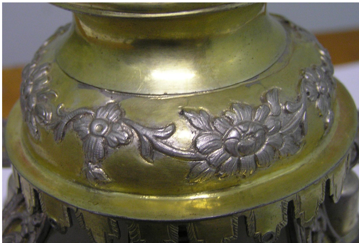
Фото 8. Зображення на уманській короні

невеличкої квітки у орнаментальну смугу. Аналогічний елемент декору використаний і золотарем, який виготовив корону Тори із зібрання О.М.Поля. Тільки майстер не закрити місця з'єднання фрагментів декоративною прикрасою.