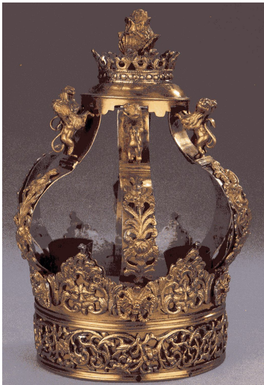
Фото 3. Корона Тори