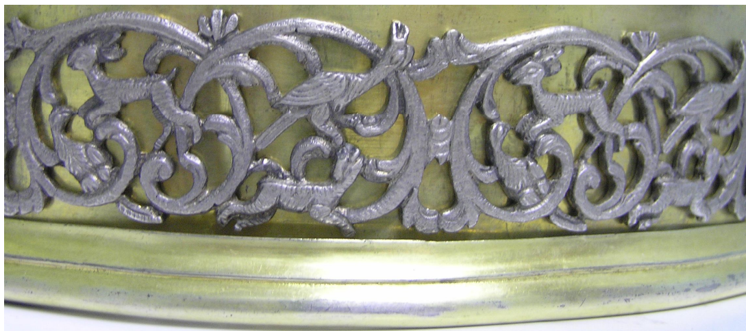
Фото 5. Зображення на уманській короні

Українське золотарство, особливо західних регіонів, зазнало також впливів з боку європейських майстрів. У багатьох містах працювали іноземні митці з Італії, Німеччини, Польщі, Франції. І ці впливи також відбилися у пам'ятках єврейського срібла. Так само і корона Тори із зібрання О.М. Поля увібрала в себе мистецькі та ремісничі надбання золотарів, що формували