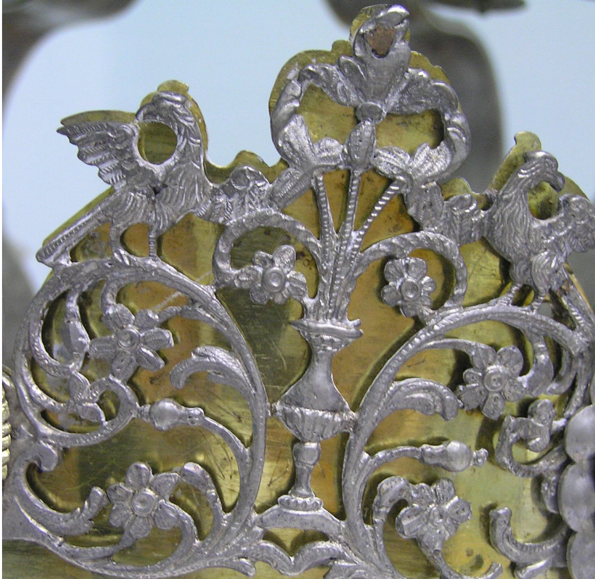
Фото 7. Зображення на уманській короні

Оздоблення корони має загалом ренесансний декор, доповнений елементами барокового звучання. Він дуже типовий для єврейського срібла XVIII ст. Щільне рослинне плетіння акантових стеблин є характерним для предметів, виготовлених майстрами різних регіонів і різних культур. Ця універсальність впадає в око при порівнянні пам'яток. Оздоблення окладу п'ятикнижжя Мойсея, виготовленого у Німеччині у XVIII ст. [фото.2] (предмет зберігається у Музеї Історичних Коштовностей України), має елементи декору, що кореспондується з творами, виготовленими в Україні [10]. Ще дві єврейські пам'ятки із колекції Музею Історичних Коштовностей – Корона Тори 1740-х років та торашилд XVIII ст. – речі українського походження [11] [фото.3, 4]. Вони прикрашені орнаментальними деталями, в основі яких лежить той таки мотив плетіння. Оздоблення цих двох предметів дає підставу говорити не лише про єдність стилю та регіону виготовлення, але і про використання мало не однієї ливарної форми. Повторюваний елемент, що складається з двох великих завитків з двома птахами та двома ланями, майстер з'єднав за допомогою