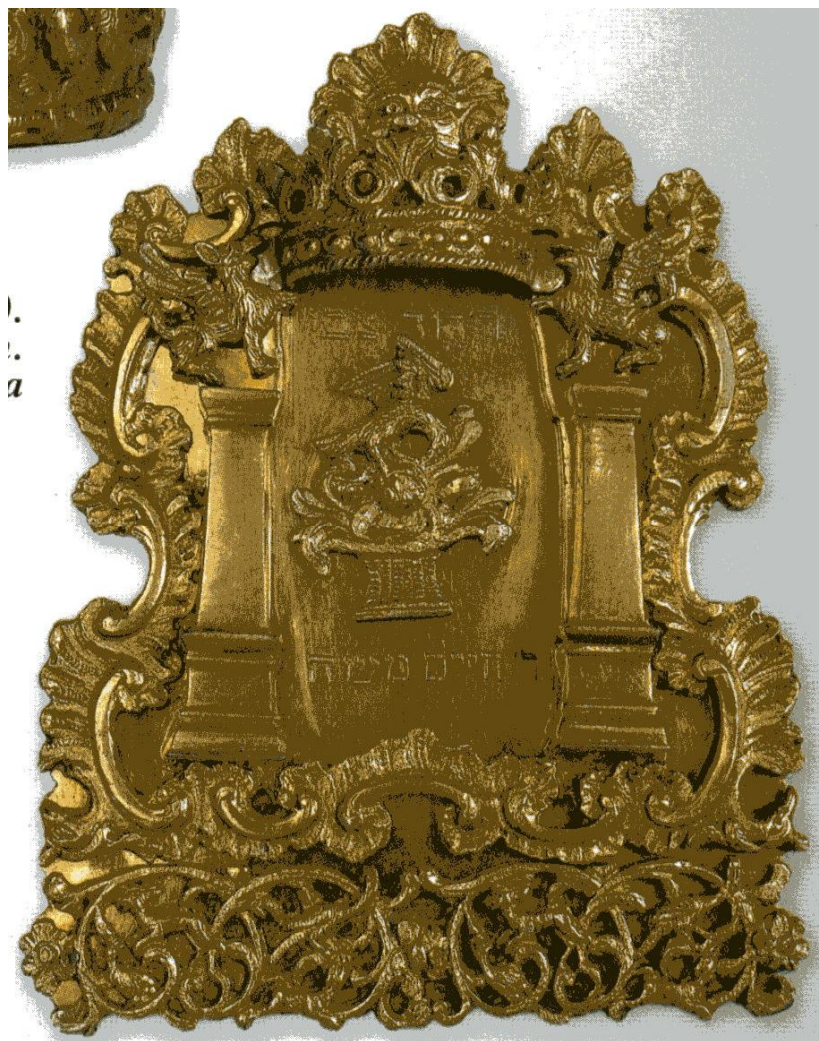
Фото 4. Торашило

Українське золотарство, особливо західних регіонів, зазнало також впливів з боку європейських майстрів. У багатьох містах працювали іноземні митці з Італії, Німеччини, Польщі, Франції. І ці впливи також відбилися у пам'ятках єврейського срібла. Так само і корона Тори із зібрання О.М. Поля увібрала в себе мистецькі та ремісничі надбання золотарів, що формували