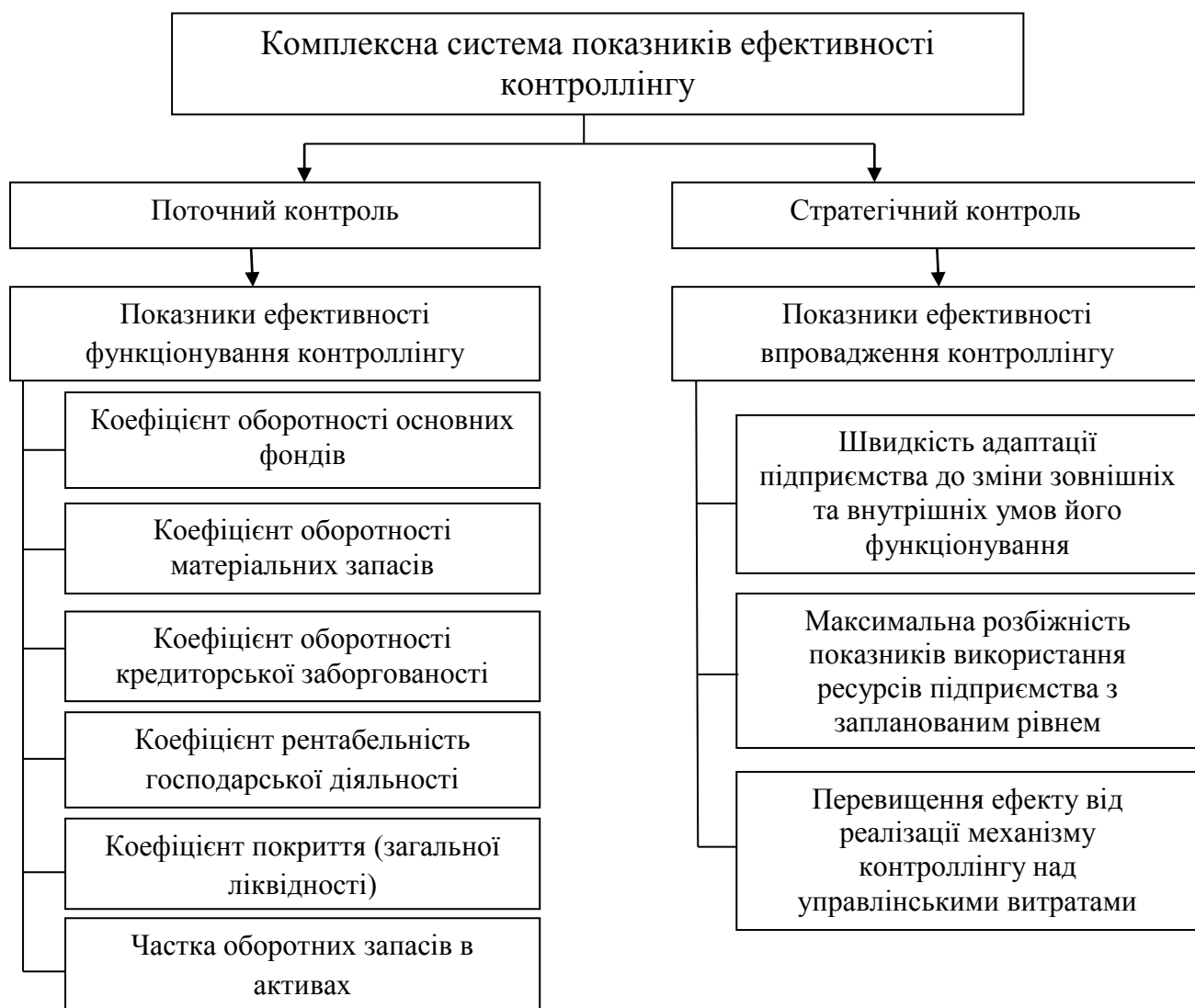
Рис. 3 Показники ефективності впровадження та функціонування механізму контролінгу*