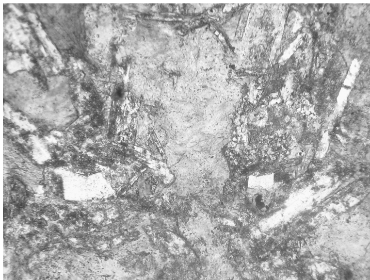
Рис. 2. Метадолерит (зразок 3): основна сіра маса – актиноліт, білі кристали правильної форми – плагіоклаз, неоднорідні зони навколо них – кліноцоїзит і хлорит, темно-сірий кристал ліворуч вгорі – бура рогова обманка. Світло прохідне, ніколі (-), збільшення 47 x

лаз серицитизований та пелітизований, також він заміщується кліноцоїзитом. В породі міститься понад 5% хлориту та поодинокі зерна кварцу. Рудний мінерал по краях заміщений сфеном. Структура бластофітова.