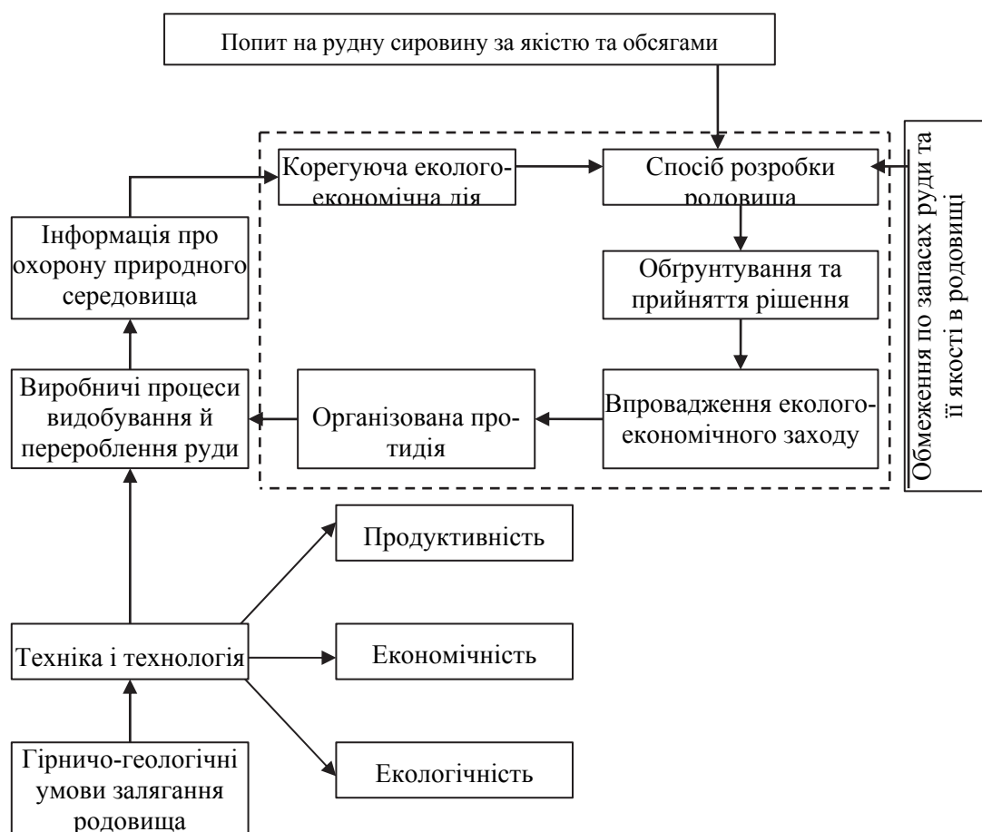
Рис. 2. Структурно-логічна схема удосконалення вихідного варіанту способу розробки залізрудного родовища

Розглянемо більш детально уточнення й оптимізацію моделі якого-небудь виробничо- го процесу видобутку й переробки рудної сировини, спрямованого на підвищення еколого- економічної ефективності способу розробки родовища, що був досліджений як вихідний (пер- вісний) варіант. Назване вдосконалення моделі повинне бути перевірене по відповідності попиту на рудну сировину за її обсягом та якістю (рис. 2). За змістом перевірки важливу роль грає обмеження за запасами руди й її якості в родовищі.