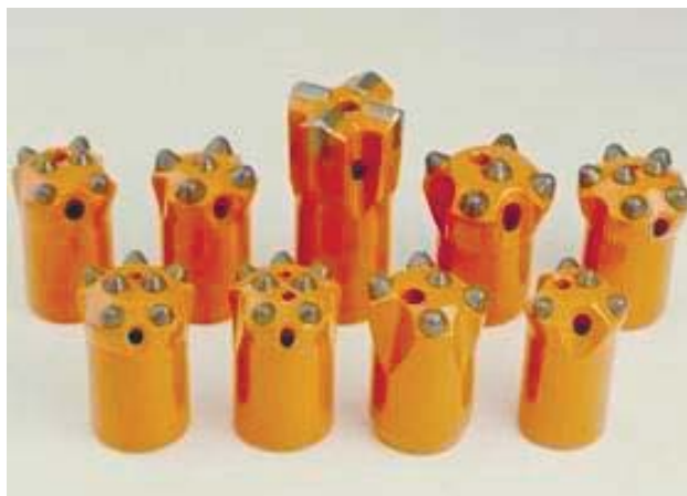
Рис. 2. Варианты альтернативных конструкторских решений буровых коронок

Таким образом, с применением новых буровых коронок на старом буровом оборудовании с пневмоприводом, а затем и на новых буровых электрогидравлических буровых каретках (одностреловая буровая каретка Boomer H251, двухстреловая буровая каретка Boomer H252, Boomer-104, Boomer-281 «Atlas-Corco» Швеция) с новыми буровыми коронками удалось поднять темпы проходки горных выработок в два раза, производительность труда повысилась в 1,5 раза, при этом снизились затраты при проходческих работах на 40 % и улучшились санитарно-гигиенические условия труда подземного персонала [3].