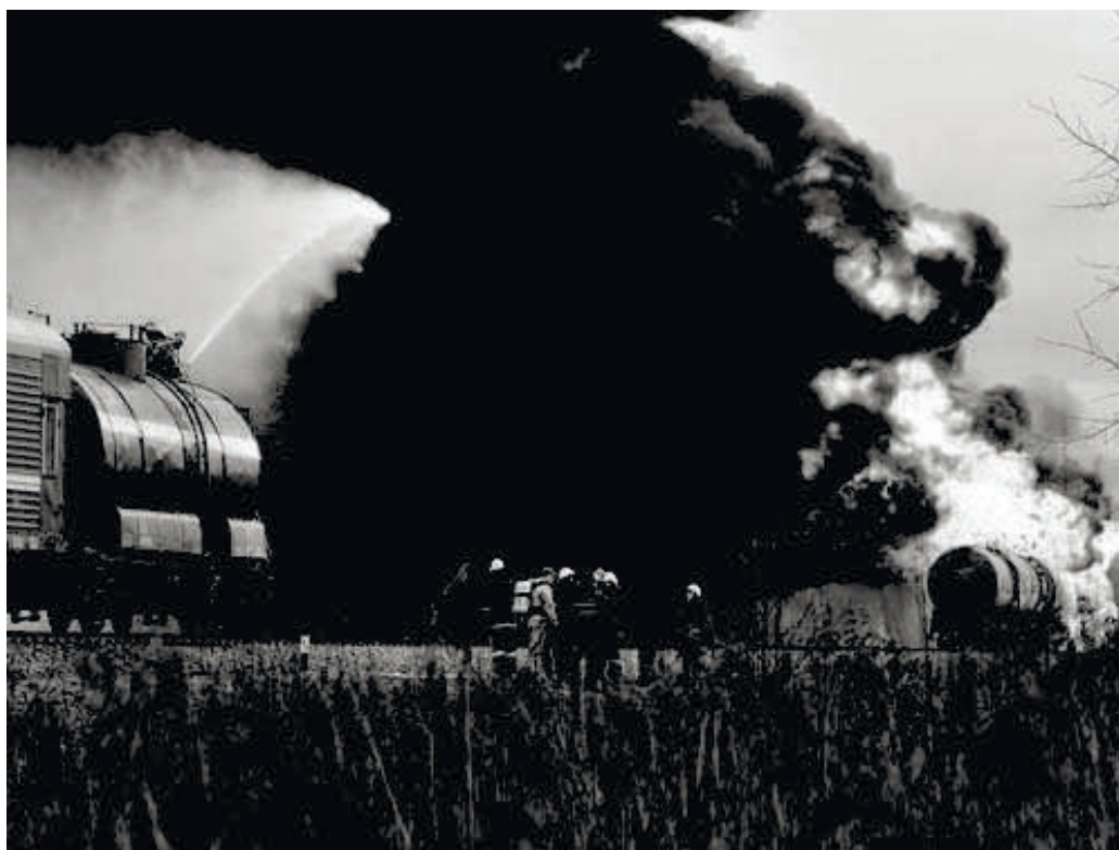
Рис. 1. Авария на железной дороге.

Актуальность. В случае аварий на железнодорожном транспорте может происходить интенсивная эмиссия химически опасных веществ в атмосферу (рис.1). Поэтому возникает важная задача по оценке уровня загрязнения примыкающей территории в случае чрезвычайных ситуаций на транспорте.