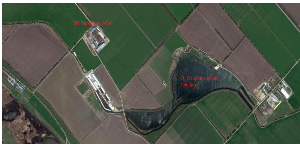
Рисунок 1 – Місце знаходження ПП «Перемога АВК»

Досліджуваний масив зрошення розташований у Дніпропетровському районі (рис. 1), за юридичною адресою с. Чумаки, вул. Садова, буд. 1. Сільськогосподарське підприємство має кведи на вирощування зернових та технічних культур, а також одним з видів діяльності підприємства є тваринництво. З півночі масив межує з с. Ульянівка, з півдня – з с. Партизанське, зі сходу – з с. Степове, з заходу – с. Зоря.