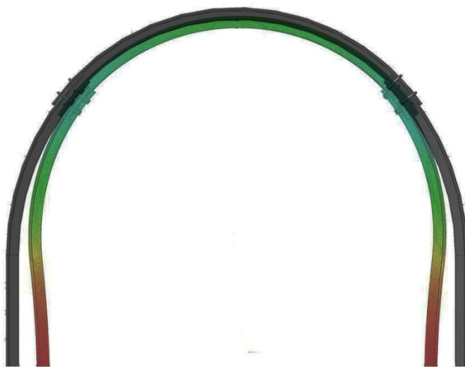
Рис. 1. Деформация крепи АП-27 под прилагаемым давлением

На рис.1 приведено визуальное сравнение исходной модели металлической арочной крепи АП-27 с той же крепью в результате ее нагружения.