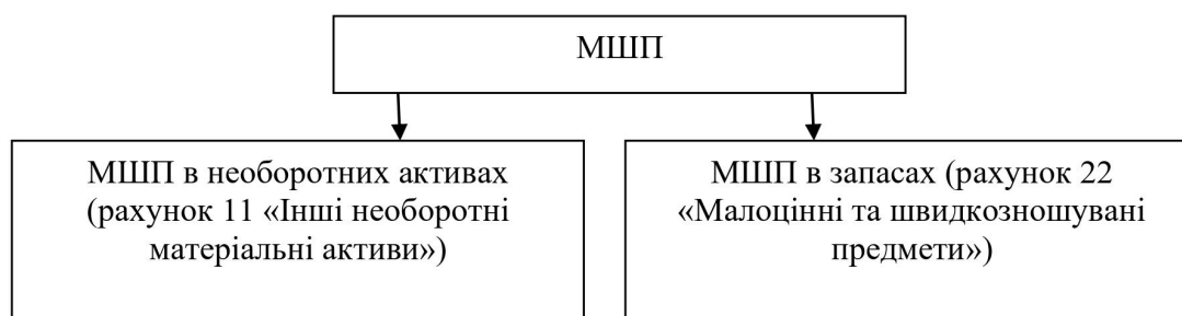
Рис. 2.3. Схема розподілу МШП, облікованих на балансі підприємства

Схема розподілу МШП, облікованих на балансі ТОВ «Реаліта» продемонстрована на Рис. 2.3: