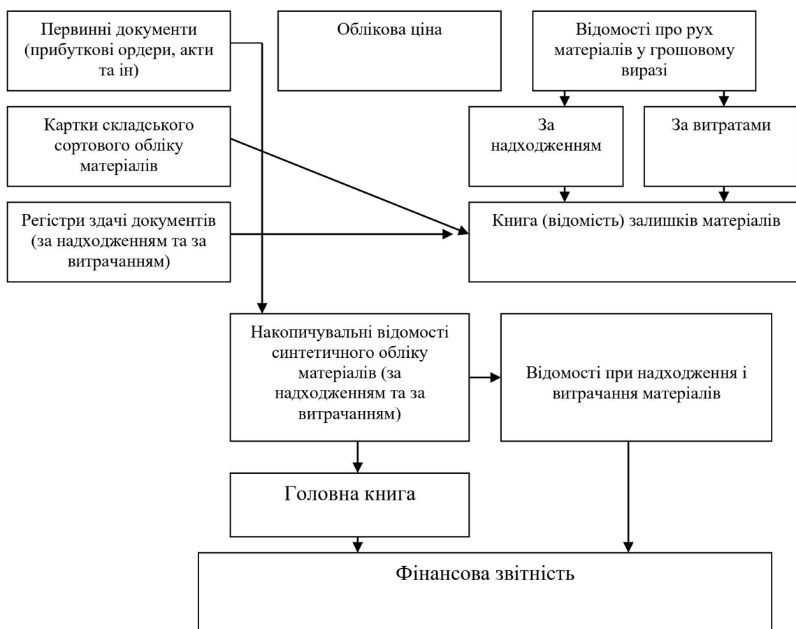
Рис. 2.1. Схема інформаційних потоків облікової інформації з руху виробничих запасів

Схема інформаційних потоків облікової інформації з руху виробничих запасів продемонстрована на Рис. 2.1: