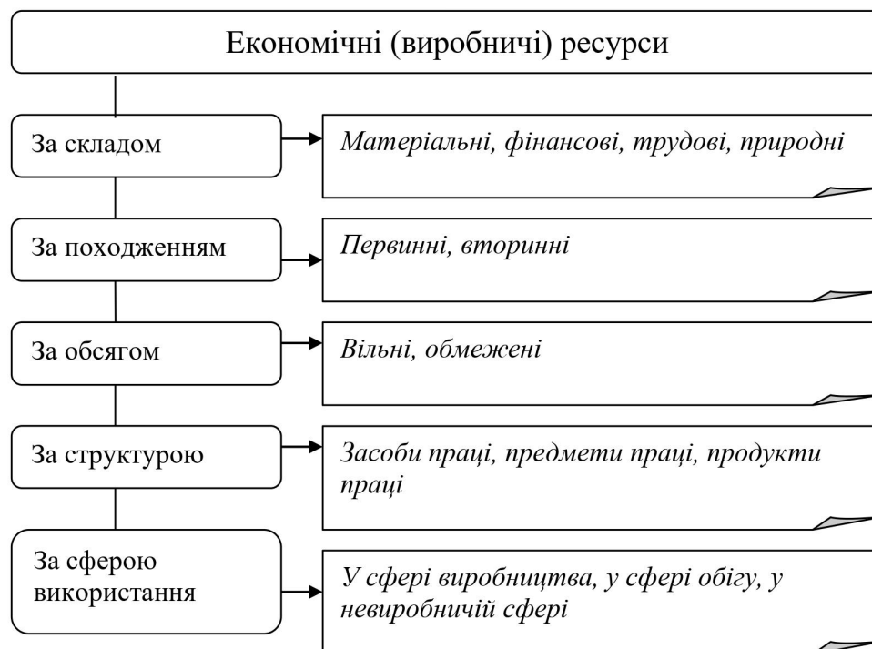
Рис.1.2. Класифікація економічних ресурсів

Покажемо на Рис. 1.3 місце товарно – виробничих запасів у складі економічних ресурсів: