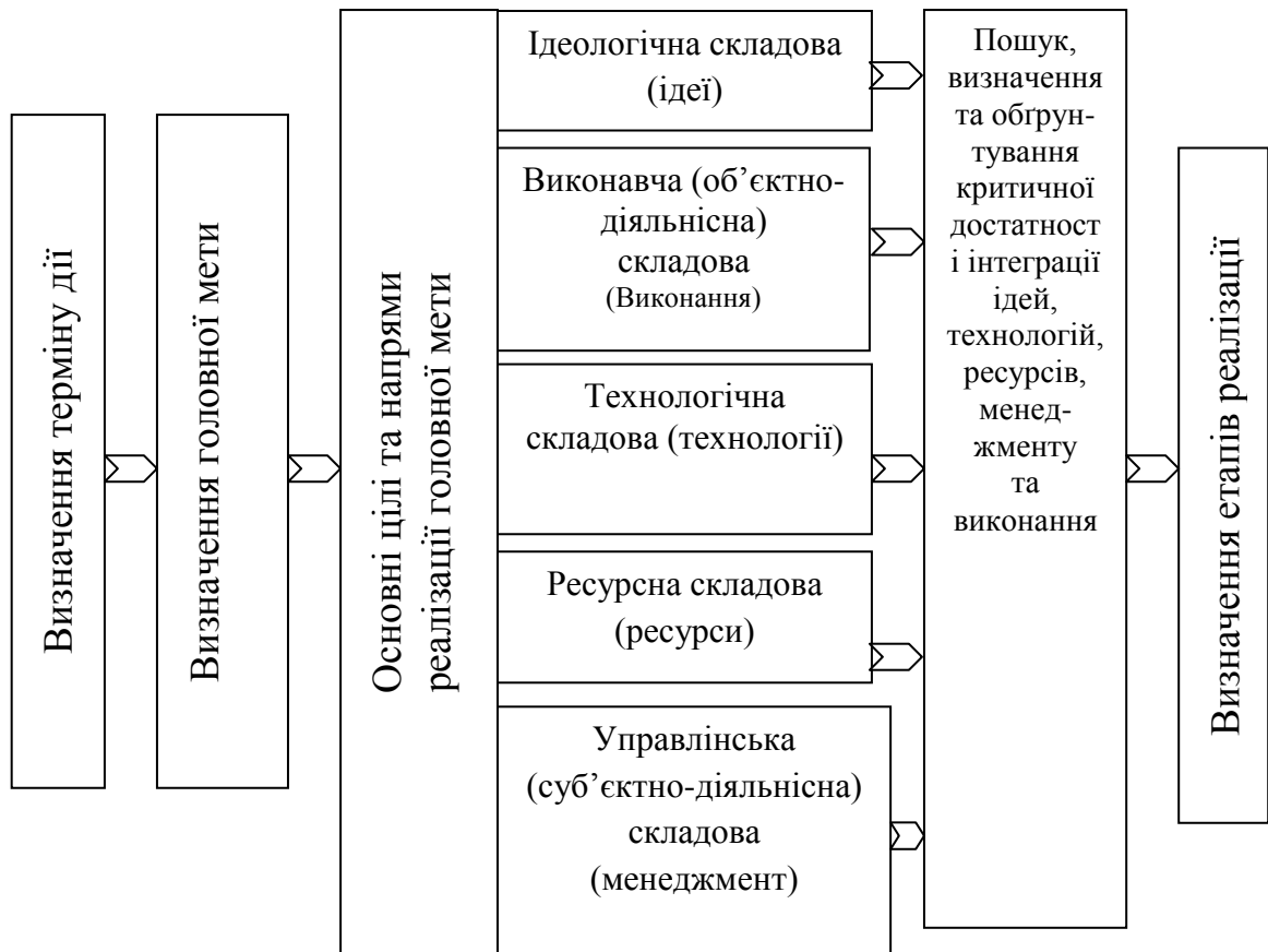
Рис. 5.1. Спрощена технологічна схема розробки концепцій за принципом досягнення самоорганізаційної спроможності розвитку [33]

Системний підхід у соціальному управлінні виходить із розгляду організацій як комплексних відкритих соціальних систем, котрі складаються з сукупності взаємозалежних підсистем, серед яких найважливішими є люди, структура, завдання та технології, що зорієнтовані на досягнення певних цілей. Він базується на загальній теорії систем, теорії багаторівневих (ієрархічних) систем та концепції структурно-функціонального аналізу. Як зазначив американський учений Т. Парсонс, рівновага соціальних систем забезпечується реалізацією чотирьох функціональних імперативів, а саме: функції досягнення цілей; адаптації системи до зовнішнього середовища; інтеграції всіх її компонентів; регулювання прихованих у ній напружень.