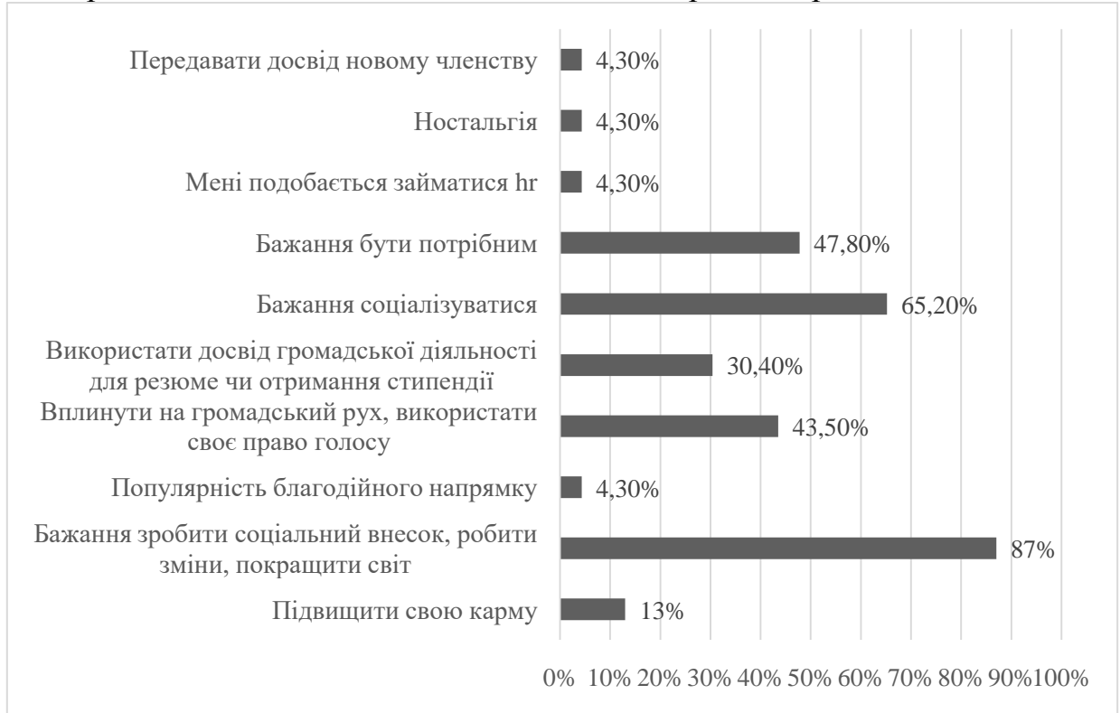
Рис. 1. Мотиваційні фактори щодо перебування в громадському секторі

Наступне дослідження було щодо мотиваційних факторів перебувати у ФРІ Дніпро, чому молодь обрала саме цю громадську організацію з багатьох інших громадських організацій міста Дніпра. Результати дослідження представлені на рисунку 2. Більшість респондентів (60,9%) із запропонованих варіантів обрала «всеукраїнське ком'юніті» та «соціалізація, неформальне спілкування». 52,2% обрала «патріотичне виховання», 43,5% – «можливість робити проекти».