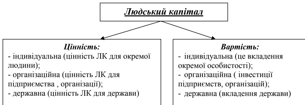
Рис.2 – Види цінності та вартості людського капіталу

Отже, розмежування цінності та вартості дозволяє визначити ефективність інвестування у людський капітал на різних рівнях: індивідуальному, мікроекономічному (на рівні підприємства) та макроекономічному (на рівні держави).