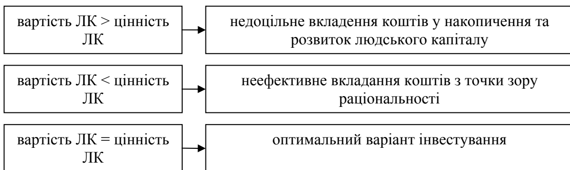
Рис. 1. Співвідношення між вартістю та цінністю людського капіталу

Отже, на нашу думку, вартість людського капіталу – це сума грошових засобів, які інвестуються у основні складові елементи людського капіталу, а цінність – величина очікуваної вигоди (як матеріальної, так і нематеріальної) від інвестицій. Можна розглядати три випадки (рис. 1)