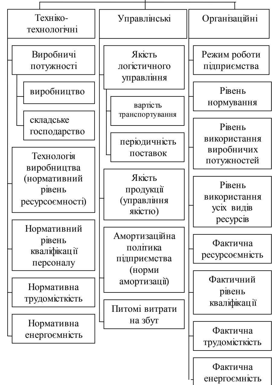
Рис.5 Класифікація факторів прямого впливу на показники бюджету підприємства, як основного інструменту механізму контролінгу