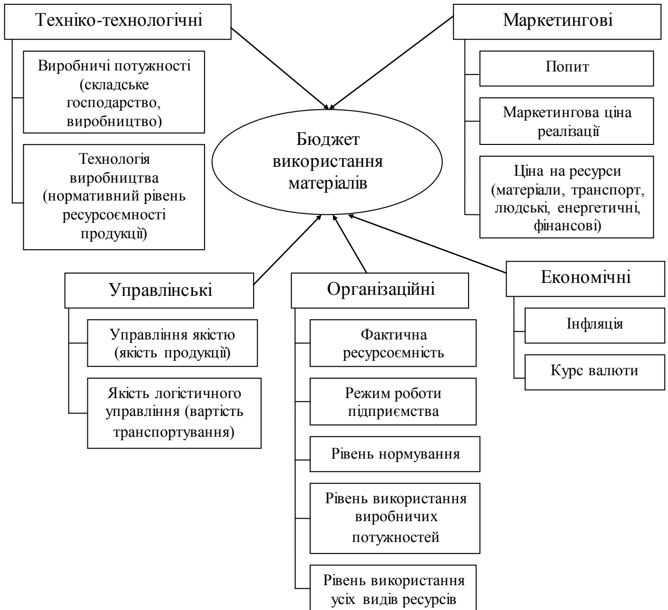
Рис.4 Групи факторів прямого впливу на показники бюджету використання матеріалів промислового підприємства

До організаційної групи факторів, під впливом дії яких формуються показники бюджету використання матеріалів, віднесено: фактичну ресурсоемність продукції ( RC_{fi} ), режим роботи підприємства ( T_i ), рівень використання виробничих потужностей ( LP_i ), рівень використання усіх видів ресурсів ( LR_i ), рівень нормування ( RS_i ).