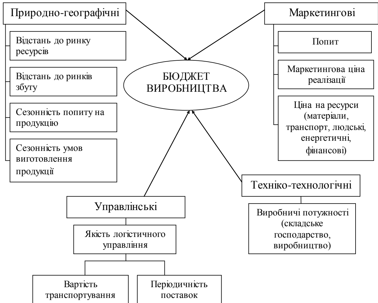
Рис.3 Групи факторів прямого впливу на показники бюджету виробництва промислового підприємства

Управління запасами готової продукції передбачає виявлення періодичності поставок готової продукції на ринок збуту та періодичності поповнення запасів готової продукції на складі. На це, як показали результати проведеного нами дослідження, впливає якість логістичного управління (вартість транспортування та періодичність поставок) (рис.3).