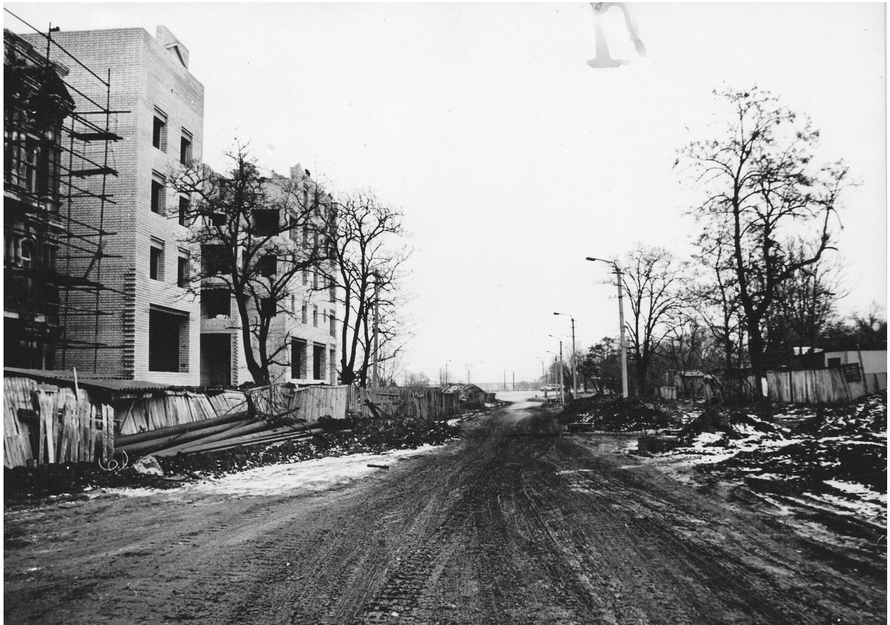
Вулиця Ливарна – найдавніша вулиця міста Дніпропетровська, спрямована на найвищу частину о.Комсомольського (Монастирського). Вулиця під час будівництва нових будинків. Початок 1990-х рр.