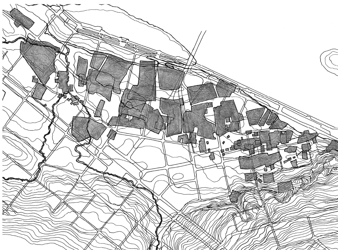
Найдавніша частина Катеринослава – площа навколо Успенської церкви. 1890-і рр.