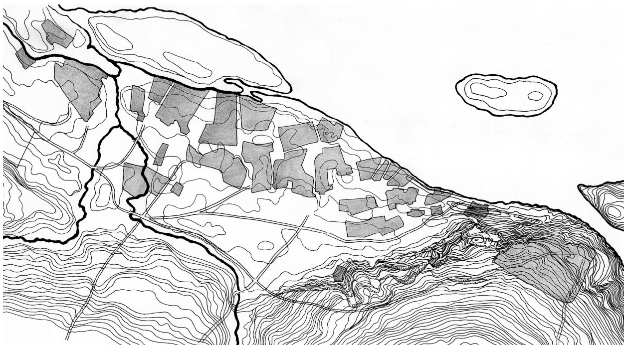
Слобода Половиця на проектному плані губернського міста Катеринослав 1786 р. (прорис автора)

розташування залишків інших споруд й повернути нащадкам сторінки рідної історії, що нещадно стираються з поверхні землі навіть зараз.