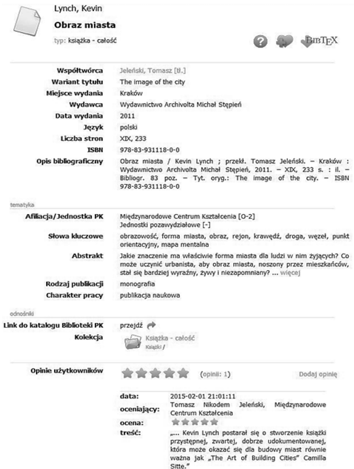
Rys. 5. Rekord z bazy Bibliografia Publikacji Pracowników PK

Zawiera ona opisy bibliograficzne materiałów opublikowanych przez pracowników PK w źródłach naukowych, popularno-naukowych i innych 3 . Rejestracji podlegają publikacje na różnych nośnikach i w różnych formatach. W roku 2013 zasoby BPP PK zostały przeniesione z bazy tworzonej wyłącznie przez bibliotekarzy do systemu SUW jako jego odrębny moduł. Od tej pory pracownicy sami wprowadzają do systemu informacje bibliograficzne o swoich publikacjach, które następnie poddane są korekcie przez wyznaczonych bibliotekarzy. Zasoby w tej bazie rosną bardzo szybko. W ciągu dwóch lat liczba rekordów