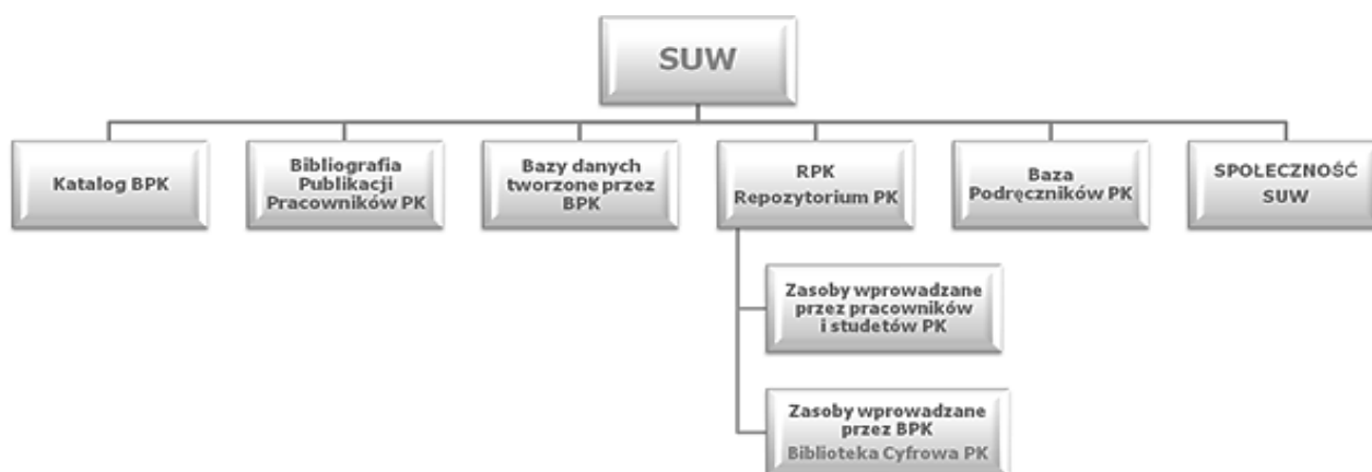
Rys. 3. Schemat systemu SUW

Platforma SUW. Niezaprzecalnie największy udział pracowników naukowych w tworzeniu zasobów Biblioteki PK możemy zaobserwować na platformie SUW, która powstała w ramach projektu 1 realizowanego przez BPK w latach 2009–2012. SUW to autorski system informatyczny, który tworzą bazy już istniejące, takie jak: katalog biblioteczny, czy bibliograficzne bazy danych – tworzone przez bibliotekarzy BPK – oraz bazy, które tworzone są przez społeczność PK metodą autoarchiwizacji, tj.: Repozytorium Politechniki Krakowskiej (RPK) oraz Bibliografia Publikacji Pracowników Politechniki Krakowskiej (BPP PK) (Rys.3). Stworzona platforma pozwala na wspólne wyszukiwanie wszystkich baz. Funkcjonalność takiego rozwiązania jest niezaprzecalna i przynosi zdecydowanie więcej korzyści, niż ograniczenie do przeszukiwania tylko jednej bazy lub jednego typu dokumentów.