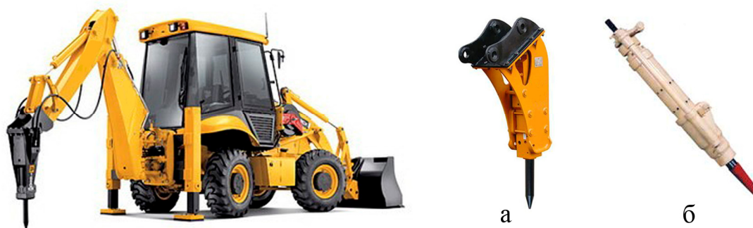
Рисунок 2 – Машина ударної дії: а – гідромолот; б – пневмомолот

З позиції реалізації найбільш ефективного способу руйнування мерзлих ґрунтів переважними є машини ударної дії, робочі органи яких здатні забезпечувати високі питомі навантаження, що призводять до утворення тріщин, відділенню мерзлих брил від масиву та їх руйнування (рис. 2).