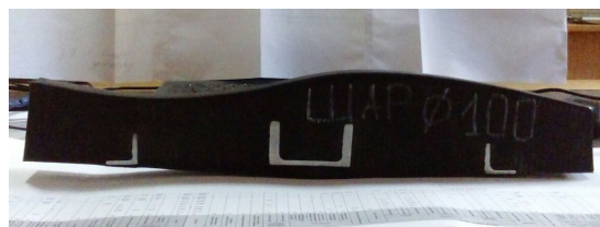
Рис. 3. – Гумова футерівка "Пдлита-Н-Хвиля"