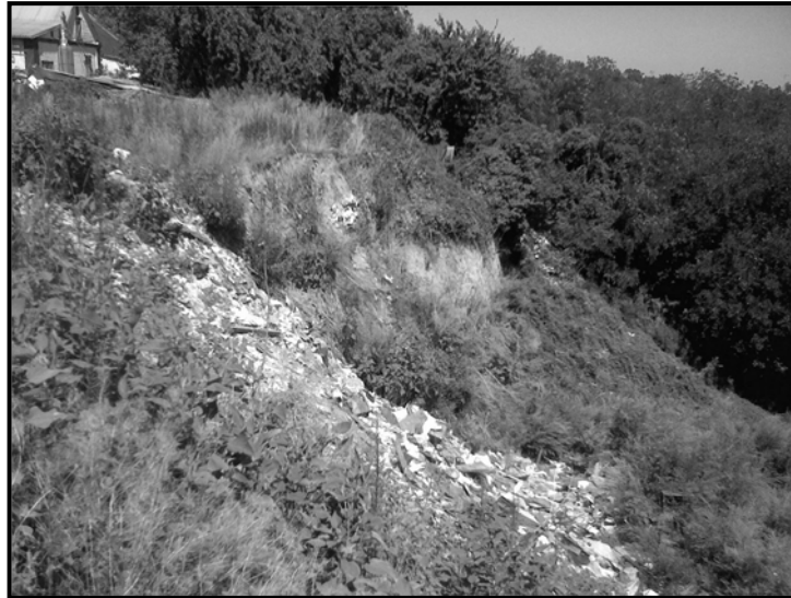
Рисунок 3. Балка Червоноповстанська. Зсув, пригнужений відходами в районі вул. Куп'янська (бл. 400 м від 16 міськклікарні) [фото автора].

Проявлення найбільш активних зсувних процесів спостерігається у Тунельній, Зустрічній (житлові масиви Тополя-1,2,3), Рибальській та Червоноповстанській балках (рис. 1,3).