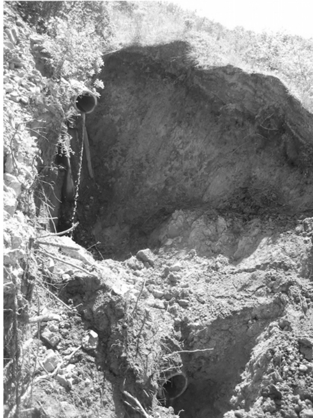
Рисунок 4. Стан скидного колектора від насосної станції №6 по вул. Космічній.

Треба відмітити, також, про стан території навколо житлового будинку по Запорізькому шосе, 19. Оцінено сукупний вплив діяльності людей на природне середовище цієї ділянки. Основне, що спостерігається незадовільний технічний стан бетонного лотку. Судячи по результатам дослідження цієї території, тут зовсім відсутня система ливневої каналізації. Внаслідок цього, відбувається неприпустиме намокання ґрунтів схилу та прояв їх просідних властивостей (рис. 5).