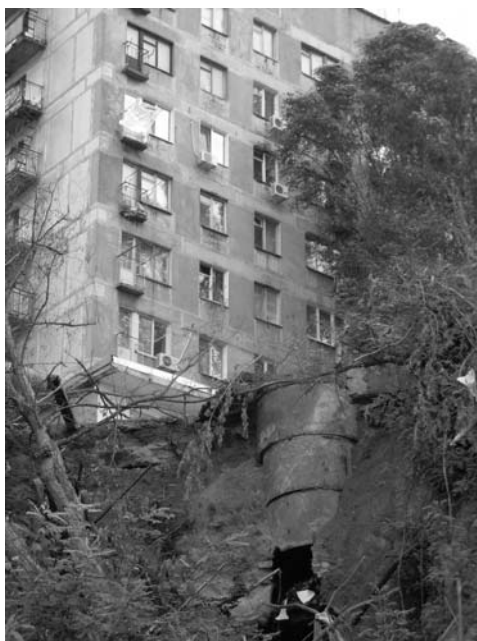
Рисунок 1. Зруйнована дощова камера . Схил Рибальської балки вздовж проспекта Олександра Поля.

При накладенні всіх цих факторів, плюс при інфільтрації зливових опадів під фундаменти, які не ремонтувалися десятками років, руйноване асфальтове покриття, напівзруйновану та засмічену зливову каналізацію, а також при наявності навантажень від будівель і споруд та вібрації транспорту, відбуваються так звані аварії техногенного характеру (рис. 1).