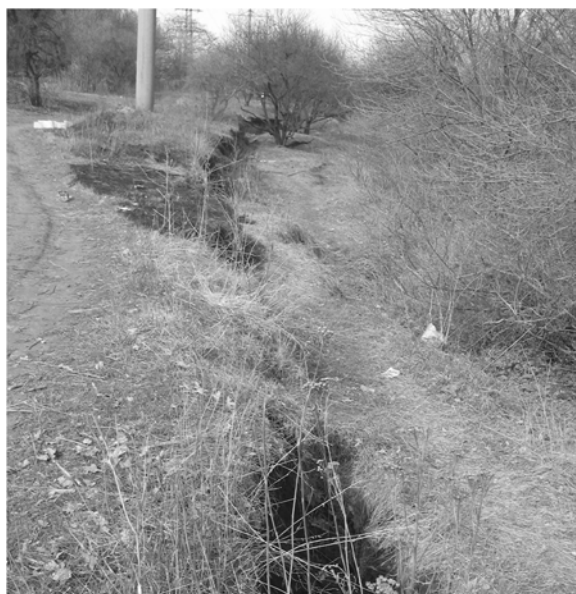
Рисунок 5. Сходінка зсуву вздовж проспекту Праці.

Треба відмітити, також, про стан території навколо житлового будинку по Запорізькому шосе, 19. Оцінено сукупний вплив діяльності людей на природне середовище цієї ділянки. Основне, що спостерігається незадовільний технічний стан бетонного лотку. Судячи по результатам дослідження цієї території, тут зовсім відсутня система ливневої каналізації. Внаслідок цього, відбувається неприпустиме намокання ґрунтів схилу та прояв їх просідних властивостей (рис. 5).