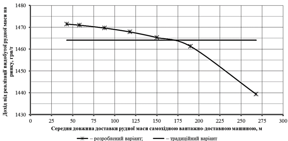
Рисунок 3. Графік залежності отриманого доходу при реалізації видобутої рудної маси на ринку від середньої довжини доставки за допомогою самохідної вантажно-доставної машини

Як видно з рис. 2, встановлено, що при збільшенні середньої довжини доставки, тобто збільшенні відстані між зонами розвантаження рудної маси, зменшуються питомі витрати на видобуток 1 т руди за системою розробки. При цьому оптимальні параметри середньої довжини доставки знаходяться в межах 125-225 м. Але збільшення середньої довжини доставки впливає на інтенсифікацію процесу випуску руди і, як наслідок, на показники вилучення. Тому наступним етапом було визначення доходу від реалізації видобутої рудної маси на ринку. Результати розрахунків приведені на рис. 3.