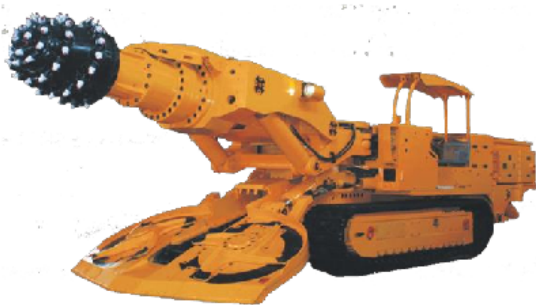
Рис. 2.2. Прохідницький комбайн EBZ-260