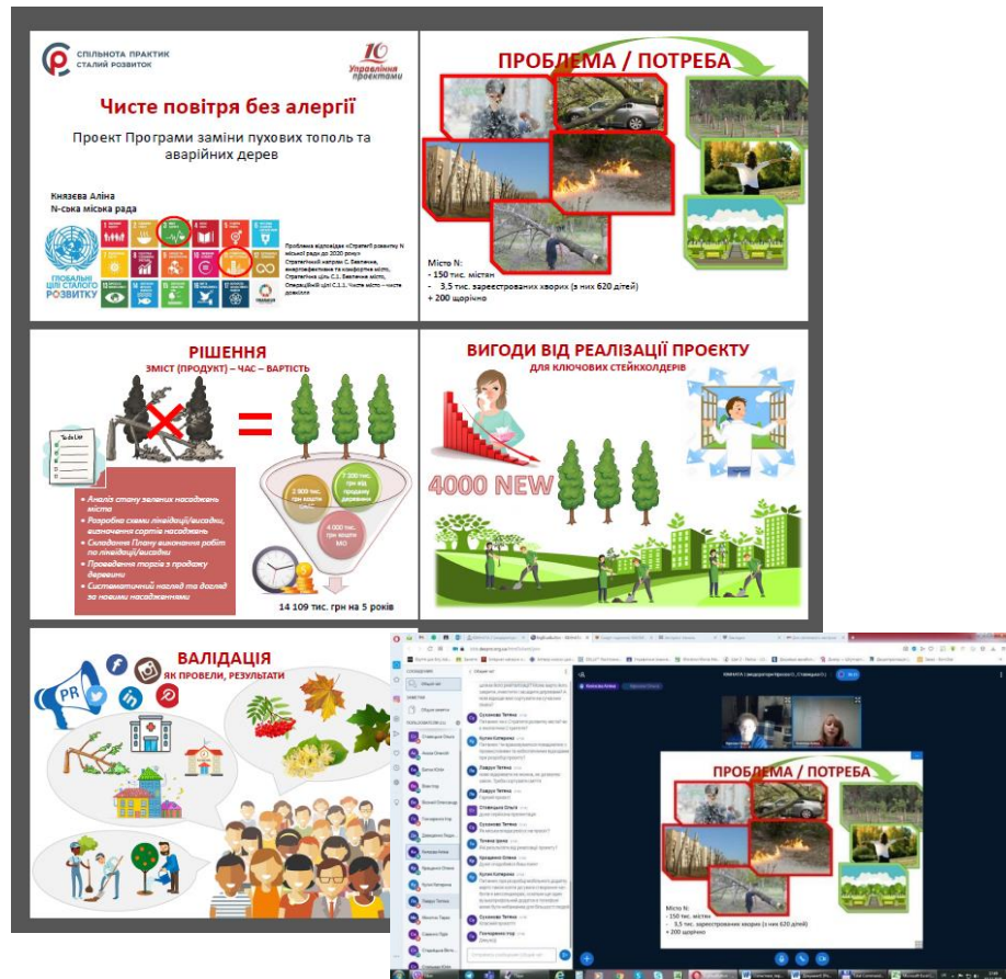
Рис. 3. Приклад презентації концепцій проєктів [4, с. 161] за напрямом «Екологія»