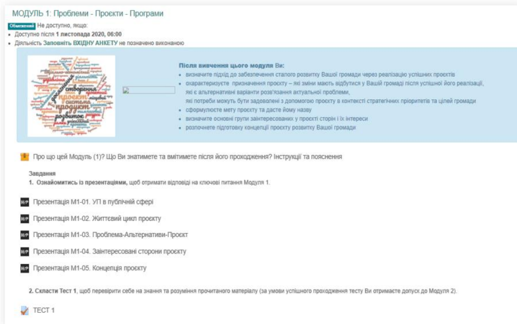
Рис. 2. Контент модуля е-курсу «Управління проєктами місцевого розвитку – 10» [4, с. 74]

Учасниками було підготовлено більше 100 презентацій власних концепцій проєктів, і 98 із них скористалися можливістю відпрацювати навички публічного виступу, переконання, зацікавлення тощо (рис. 3).