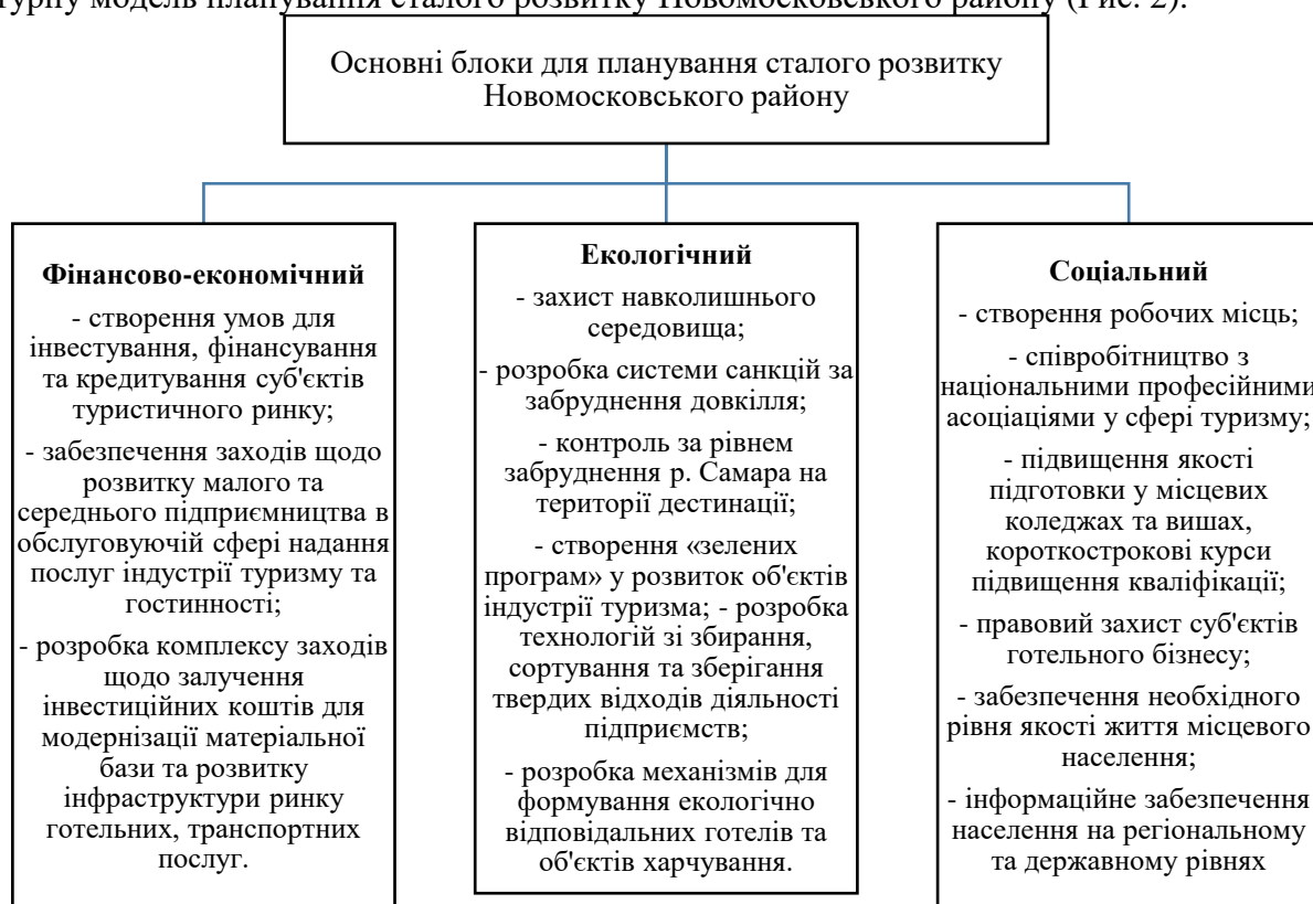
Рисунок 2 – Основні блоки для планування сталого розвитку Новомосковського району

Аналіз динаміки розвитку основних показників туризму та туристичної інфраструктури в регіоні, а також оцінка факторів сталого розвитку дозволили авторам сформулювати структурну модель планування сталого розвитку Новомосковського району (Рис. 2).