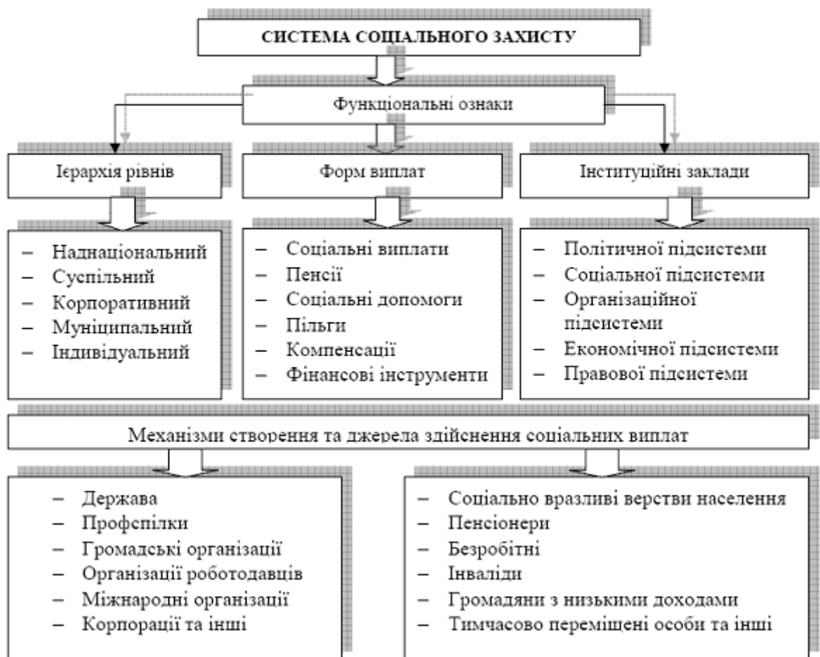
Рис.1.1. Система соціального захисту населення

Система соціального захисту в Україні включає пенсії, допомоги працюючим (у разі тимчасової непрацездатності; у зв'язку з вагітністю та пологами тощо), багатодітним та самотнім матерям, малозабезпеченим сім'ям з дітьми; утримання та забезпечення для людей похилого віку та інвалідів у будинках-інтернатах, протезування; професійне навчання та працевлаштування інвалідів; пільги інвалідам та інше (рис.1.1.) [91, с. 93].